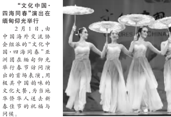
“文化中国·四海同春”演出在缅甸仰光举行 2月1日,由中国海外交流协会组派的“文化中国·四海同春”亚洲团在缅甸仰光举行春节访问演出,首场表演,演出极具中国韵味的文化大餐,为当地华侨华人送去新春佳节的祝福与问候。