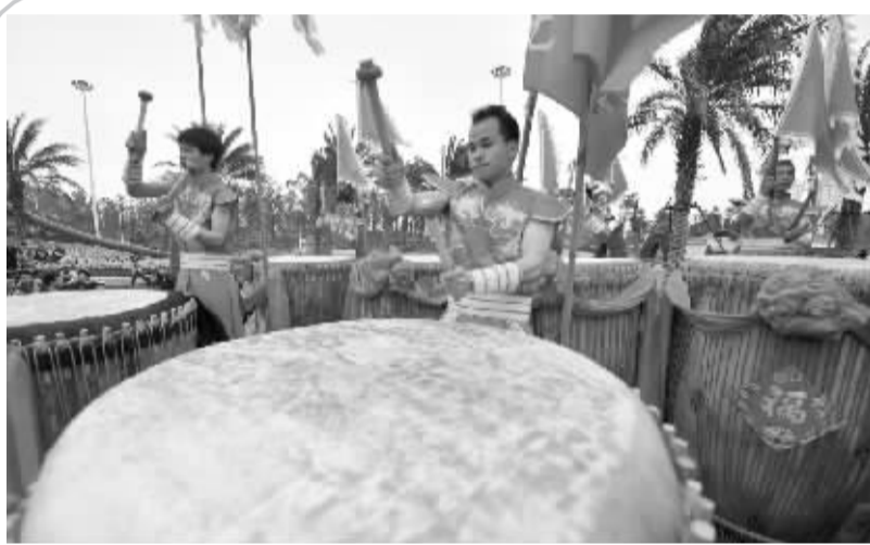
广西钦州:千年大鼓闹新春 2月2日,钦州市灵山县沙坪镇的鼓手在比赛中。当日,一年一度的“钦州市烟墩大鼓大赛”在广西钦州园博园举行,当地18支壮、汉族民间大鼓队200多名鼓手参加比赛,吸引众多市民前来欣赏,把迎春喜庆气氛推向高潮。

“欢乐春节”庙会1月28日在委内瑞拉首都加拉加斯市中心玻利瓦尔广场隆重举行。来自中委两国的艺术家在现场表演了歌舞、武术、舞龙舞狮、服装秀等具有民族特色的节目。在玻利瓦尔广场上的20多个临时展厅中,展示了中国书法、剪纸、瓷器、茶艺、中医、针灸和美食等,吸引了数千当地民众驻足观看。中国驻委内瑞拉大使赵本堂说,2016年中国与委内瑞拉政治互信不断加强、务实合作取得积极成果、人文交流日益密切。在新的一年里,双方的友好关系和两国人民的友谊将不断加强。