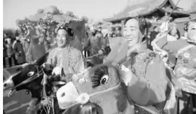
文化庙会庆新春 这是2月2日拍摄的呼和浩特文化庙会上的秧歌表演。当日,为期十天的内蒙古自治区呼和浩特2017年文化庙会开幕,期间将举行民间社火展演、非物质文化遗产传承、贺新春书画笔会、历史风貌图片展等活动,让人们在品味民俗文化中喜迎新春。