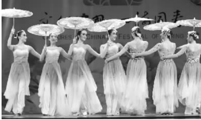
图话新闻