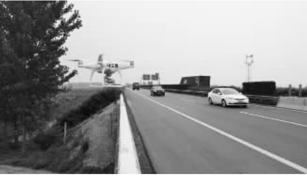
无人机巡航抓拍高速公路交通违法

周口市公安交通管理支队用满腔的激情唱响着青春赞歌,书写着一路忠诚的绚丽华章。周口交警永远在路上,他们栉风沐雨、披星戴月,为了周口辖区道路的畅通、为了人民的生命财产安全不辞辛劳。新的一年,他们又踏上了新的征程,只为无悔的追求、群众的期盼和神圣的职责!