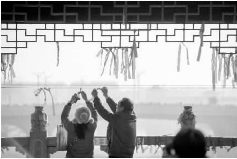
安徽：正月十六“走太平” 2 月 12 日,人们在太平桥上系上“平安带”,祈求平安幸福。当日是农历正月十六,安徽省全椒县独特的传统民俗活动“正月十六走太平”拉开帷幕。当地群众和来自各地的游客走上全椒县太平桥,参加一年一度的“走太平”等系列文化活动,为新年祈福。

经济效益相挂钩的约束机制。 据介绍,在未来 5 年内,原则上山西省国有煤矿一律不新招聘普通矿工,而是从现有人员中进行调剂;对普遍超员的一般性管理人員在未来 5 年内,采取退 2 进 1 或退 3 进 1 的政策,新进人员必须达到一定的技术和管理要求;对新企业、新项目一定要按照国际、国内同类项目的先进标准来定人定编。没有编制的人员是没有渠道支付薪酬的,从制度上掐断随意进人的渠道。积极探索使用第三方劳务的方式,减轻企业人员负担。