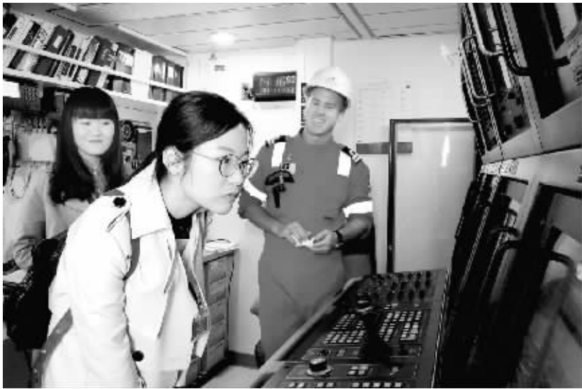
参观“决心”号大洋钻探船 2 月 11 日,香港中文大学理学院的学生在“决心”号上参观。2 月 11 日,香港中文大学师生登上停靠在香港维多利亚港招商局码头的美国“决心”号大洋钻探船参观。“决心”号目前正在进行离港前的紧张补给,即将奔赴南海开展第三次南海大洋钻探,执行(IODP)367 航次任务。

营改增试点在减轻纳税人税收负担的同时,还打通了二、三产业增值税抵扣链条,消除了重复征税,加速产业分工细化,拉动服务业发展,促进制造业主辅分离、做大主业、做强辅业。