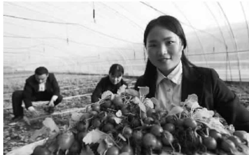
科技创新春满园 2月14日,在江苏省盱眙县明祖陵现代农业科技园,工作人员在展示刚采摘的樱桃萝卜。近日,江苏省淮安市盱眙县明祖陵现代农业科技园引入的“立体栽培”“气雾栽培”等一批科技创新项目相继投产,为早春的园区勾勒出一幅幅充满春意的画卷。

各界人士可在3月14日前登陆中国政府法制信息网(网址: http://www.chinalaw.gov.cn),通过网站首页左侧的《法规规章草案意见征集系统》,对征求意见稿提出意见。