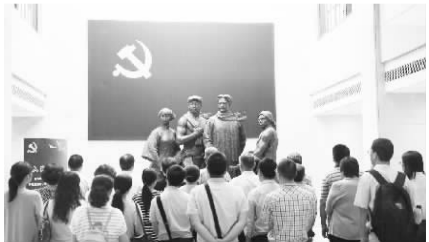
中共二大会址纪念馆闭馆改建 2月15日，位于上海老成都路路的中共二大会址纪念馆正式闭馆改建，改建工作将持续到6月30日，馆内新的基本陈列将于7月份全新亮相。

铁路部门提示，节后客流持续高位运行，已成功预订但尚未取票的旅客，请尽量提前办理取票手续，以免在取票高峰时因取票不及时而耽误行程。特别是学生旅客，除保管好身份证外，取票进站过程还须查看学生证，请随身携带并确认学生证内火车票优惠卡完好无损，以免影响出行。