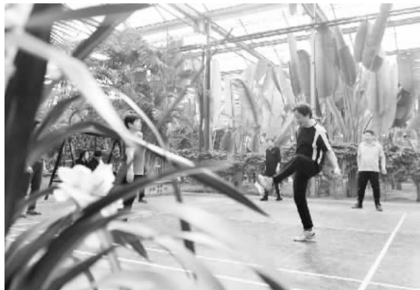
全民健身——“温室氧吧”健身乐 2月16日，市民在“体育公园”内踢毽子。位于河北省廊坊市安次区的一处室内生态休闲综合体里，植物常绿，四季如春，其中的“体育公园”区域设有羽毛球、乒乓球等场地和器材，吸引了众多市民前来健身休闲。

按照河南省最新发布的《关于进一步完善机动车停放服务收费政策的实施意见》，今后，河南省将放开具备竞争条件的停车设施服务收费，逐步缩小政府定价管理的停车服务范围，鼓励社会资本建设停车设施，建立健全主要由市场决定价格的停车服务收费形成机制。