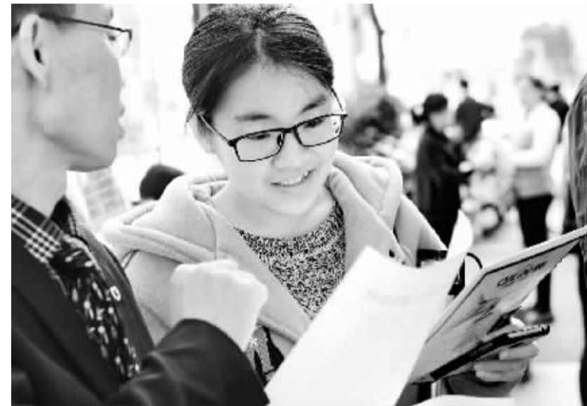
福建莆田：“春风行动”为妇女送岗位 2月16日，企业招聘人员(左)在莆田举行的妇女专场就业招聘会上向应聘者介绍用工信息。当日，福建省莆田市举行2017“春风行动”妇女专场就业招聘会，当地100家企业参会，提供2000多个岗位让应聘者选择。

同时，这份工作要点还显示，国家文物局将在2017年强化文物安全监管，如：深入开展打击防范文物犯罪活动，建设中国被盗文物数据信息发布平台；继续实施文物平安工程，不断完善高风险全国重点文物保护单位防火防盗防破坏设施；开展重点地区革命文物安全状况调研，启动全国文物安全大数据建设等。