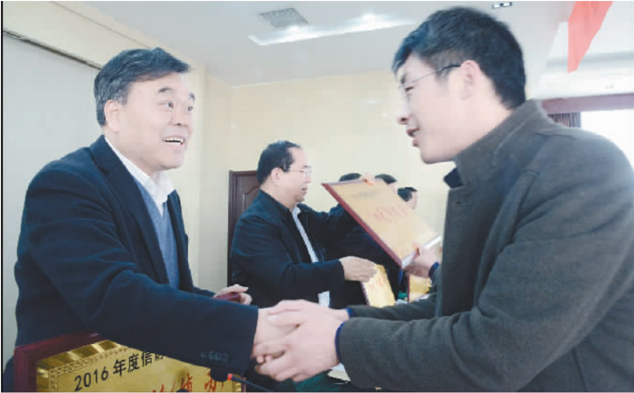
刘继标、丁福浩等市领导为受表彰的先进集体和先进个人颁奖。

刘继标强调,要明确任务,抓住重点。全市政法工作和推进全面依法治市的主要任务,就是“营造一个环境、做到四个确保、抓住五个重点”。“营造一个环境”,就是为迎接党的十九大胜利召开营造安全稳定的社会环境。“做到四个确保”,就是确保全市不发生大规模群体性事件,确保全市不发生重大公共安全事故,确保全市不发生持续性负面舆论炒