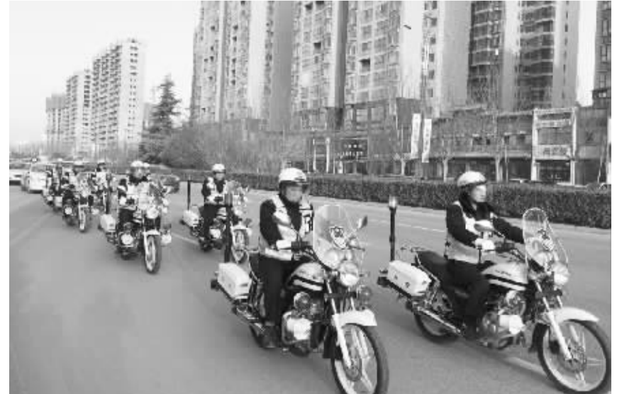
近日，西华县公安局召开全县公安工作会议，回顾总结2016年全县公安工作。会上，县领导对公安工作先进单位、先进个人、十佳辅警等进行表彰，深入分析当前面临的形势任务，安排部署今年重点工作。会议要求，全县公安机关要坚持抓班子、带队伍、强基础、补短板、树形象、育亮点，以“社会稳定、人民满意”为目标，凝心聚力，务实创新。因为县公安局局长张宗锋为十佳警嫂颁奖。

近日，市公安局交警支队五大队按照路面见警车、路口见交警的管理模式，强化路面巡逻管控，全力构筑畅通、平安的道路交通环境。大队长坚持带头上路，加强查勘、查岗、督导力度，及时掌握执勤执法和路面管控情况，确保各项措施得到有效落实。因为该大队在文昌大道开展巡逻。