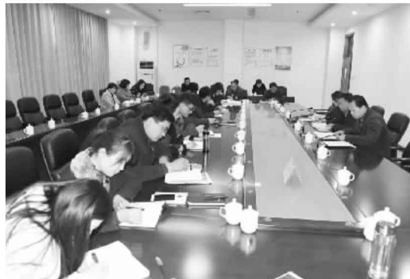
今年以来，周口开发区党委加强机关党建工作。图为3月11日，机关第一支部组织集中学习。

每个人奋斗的脚步，都将会定格为历史。我们党员干部只有以永远在路上的恒心和干劲锻造忠诚干净担当的作风，才能不负伟大的时代。