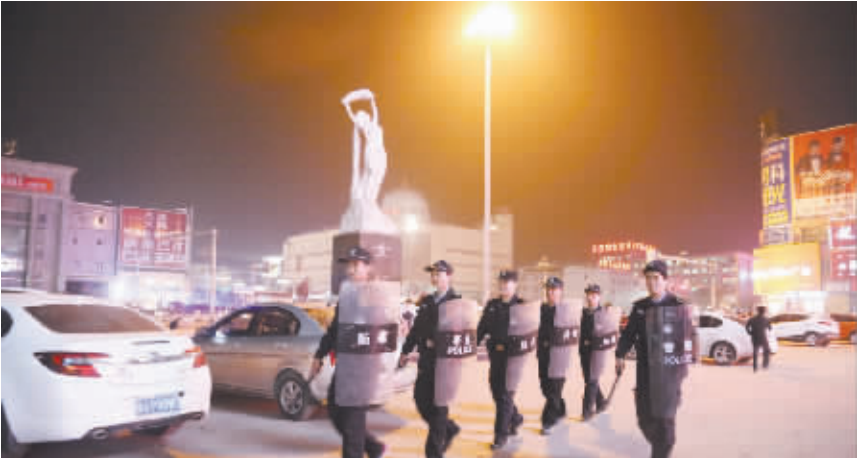
图为公安民警正在街头巡逻。

截止目前,该县新建、改造了456个警务工作站,在200名巡防队员的基础上,新招录60名专业军人和185人包村辅警;警大基地、涉案财物管理中心、武警中队驻地成功投入使用;派出所新建、改建项目全面推进,完成了看守所二级、拘留所三级创建工作。人防、技防、物防建设取得新成效,整合并上传市级平台监控探头1212个,视