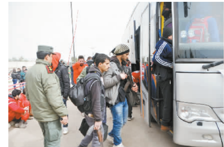
叙利亚霍姆斯最后一批反政府武装人员开始撤离 3 月 18 日,在叙利亚霍姆斯市瓦伊尔区,反政府武装人员准备撤离。叙利亚中部城市霍姆斯最后一批反政府武装人员 18 日开始从当地撤离,撤离过程将持续数周时间。霍姆斯是叙利亚爆发冲突最早的地方之一,曾是叙重要的工业中心,也是第三大城市。

新华社莫斯科 3 月 18 日电(记者 余海)俄罗斯议会两院官员 18 日批评说,美国国务卿蒂勒森日前暗示可能将核武器引入日本、韩国,如果这成为事实,将严重违反国际条约,破坏国际安全,俄将就此加强自身核安全。 俄新社消息说,蒂勒森 17 日在韩国首都首尔接受美国福克斯新闻频道采访,当被问及韩国和日本是否应该拥有核武器作为防卫手段时,他表示,一个无核化的朝鲜半岛使日本无需拥有核武器,目前华盛顿在分析各种可能性,但美方没法预测未来,如果东北亚地区局势发展到一定程度,出于遏制目的,美方将研究“那种”可能性。 针对蒂勒森的表态,俄联邦委员会(议会上院)国防和安全委员会主席奥泽罗夫表示,蒂勒森这番讲话是不负责任的表现,核扩散将带来令人恐惧的威胁,这是令人无法容忍的行为。他表示,“俄将关注并研究东北亚局势发展,必须情况下,俄将设法加强自身核安全”。 俄联邦委员会国防和安全委员会第一副主席克林采维奇认为,蒂勒森的表态值得警惕。美方如不按规矩出牌,那实在是糟透了。 俄联邦委员会国际事务委员会主席科萨切夫表示,如果美国在日韩部署并掌控核武器,那将很不利于朝鲜半岛问题的解决。如果美国向日韩提供核武,将严重违反《不扩散核武器条约》。 俄国家杜马(议会下院)国防委员会第一副主席科拉索夫指出,蒂勒森的言论代表美国一贯的鹰派立场,意在挑起冷战和军备竞赛。“莫斯科应与国际社会一道制止这一企图,同时加强俄军的战斗力。” 俄国家杜马国际事务委员会第一副主席诺维科夫强调,如果美国的这一打算成为现实,非但对俄罗斯构成直接威胁,还将严重恶化亚太局势,破坏国际安全。