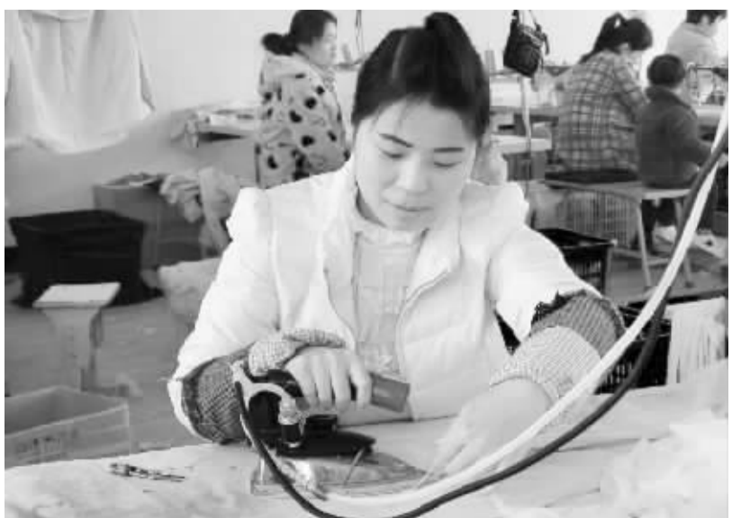
近年来,沈丘县积极拓展留守妇女就业渠道,采取“公司+基地+农户”的经营模式,发展带动当地贫困户参与家庭手工业生产,解决农村劳动力尤其是农村妇女的就业问题,加快当地脱贫步伐。图为周营乡周营村村民正在加工点加工服装。