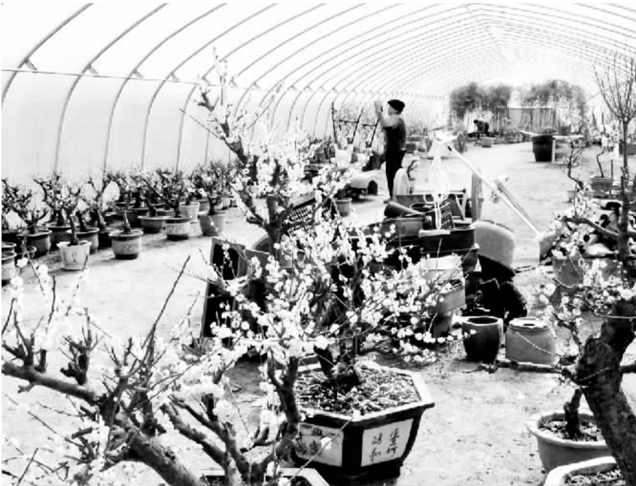
昨日,淮阳县新站镇一梅花基地内一名员工在整理盆栽梅花。该基地占地1000多亩,有600多株老梅树,品种达130多个,经过改良的梅花花期可达3个多月。眼下,大棚内外的梅树已开得灿若云霞,是市民踏青赏梅的又一好去处。

“防护墙”。几年来,项城市始终坚守发展决不能以牺牲安全为代价这条不可逾越的红线,做到不碰、不触,保障了广大人民群众的生命和财产安全。但是,安全生产工作只有起点没有终点。“项城市仍要持续发力,扎扎实实,继续夯实基础,让生产更加安全、社会更加稳定、人民更加幸福”。周口市政府安委会副主任、市安监局局长孙鸿俊对项城市的安全生产工作寄予厚望。