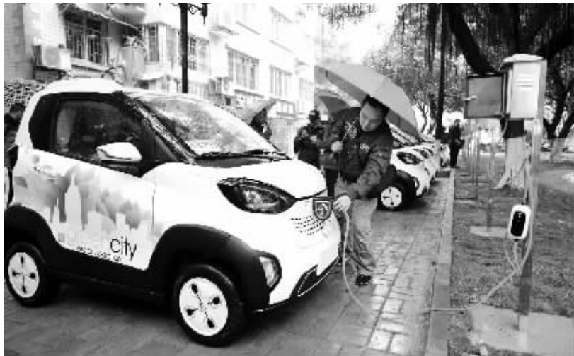
广西柳州大力推广新能源汽车 3月28日，在一个新能源汽车示范小区，居民使用普通插座充电桩给新能源汽车充电。

截至目前，今年汽油、柴油价格已经历6轮调价周期，其中3次下调、2次上调、1次“搁浅”。今年以来，汽油和柴油价格每吨分别累计下调265元和255元。