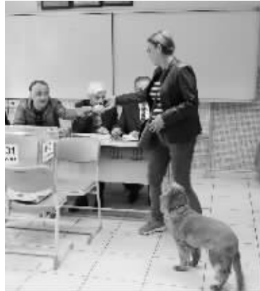
土耳其修宪公投境内投票正式开始

4 月 16 日，在土耳其首都安卡拉，一名选民领取选票。土耳其修宪公投境内投票当地时间 16 日 7 时（北京时间 12 时）正式拉开帷幕。