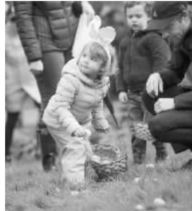
温哥华举行复活节彩蛋活动

4 月 15 日，在加拿大温哥华，孩子们在草地上寻找彩蛋。温哥华植物园 15 日为庆祝复活节举办第九届寻彩蛋活动，吸引了众多市民参加。