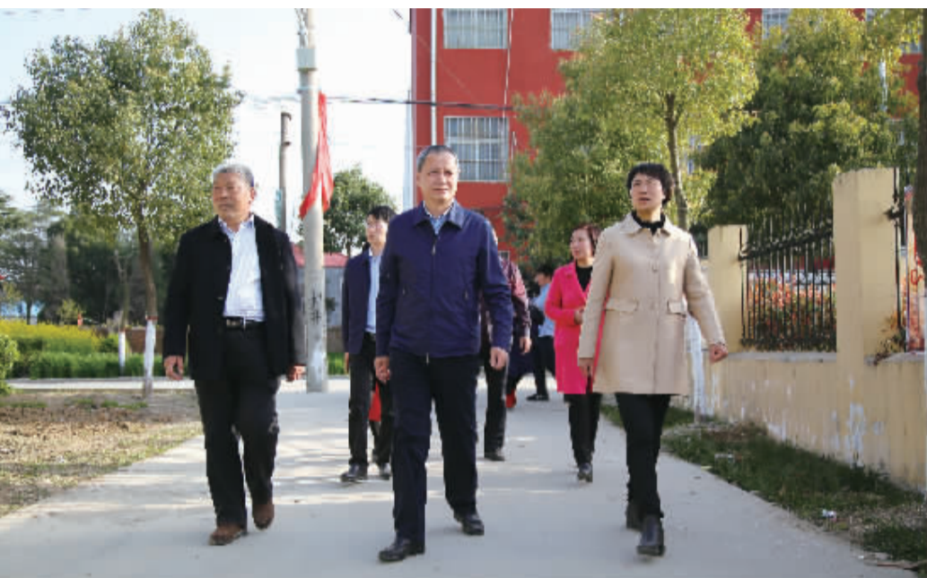
今年3月，项城市委书记刘昌宇调研美丽乡村规划建设工作。