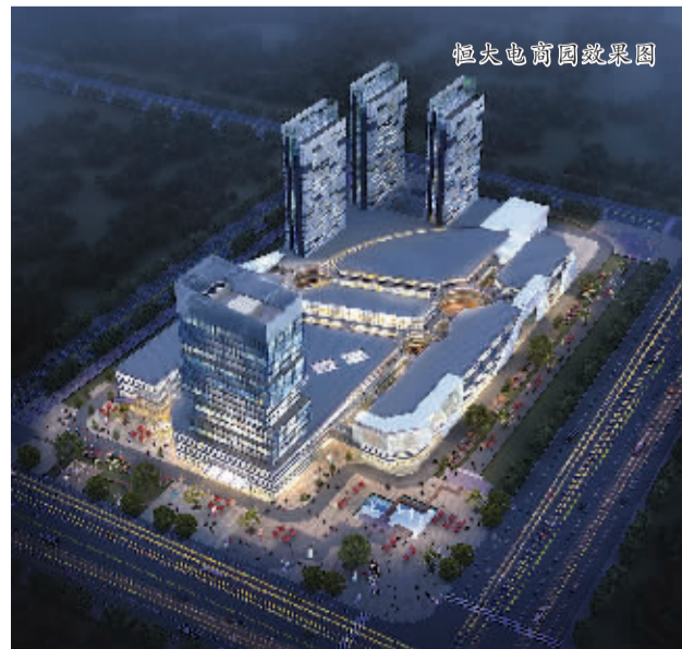
恒达电商园效果图