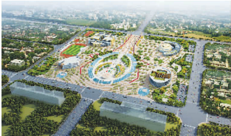
西华县博图中心、文化演艺中心、全民体育活动中心、科技展览青少年活动中心、室外体育场及女娲文化中心广场效果图