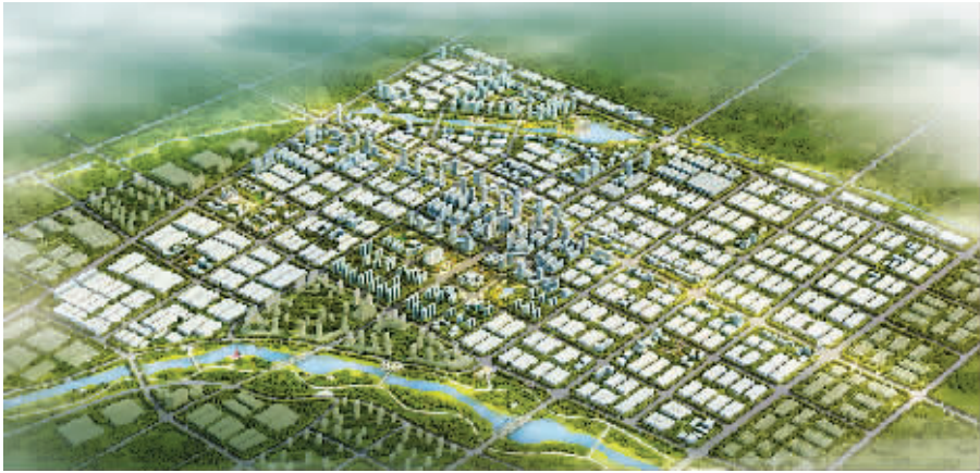
西华县经济开发区效果图