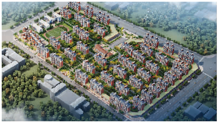
西华县花园安置小区效果图