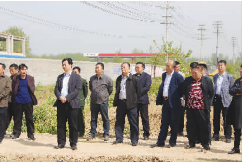
县委书记林鸿嘉带队观摩城市建设