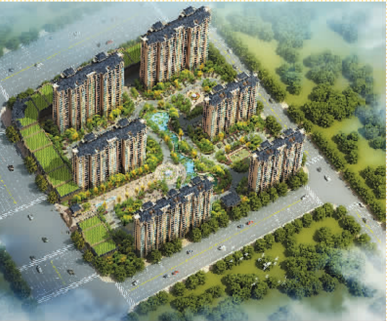
西华普罗旺斯小区效果图

西华普罗旺斯小区项目位于西华县箕城路与教育大道交汇处，项目占地39亩，规划建设6栋高层，开发建设600余套高端精品住宅。该项目由河南金三元置业有限公司倾力打造，始终遵循“高起点、高投入，高科技、高质量原则，以人为本，客户第一”的规划设计宗旨，与上海三菱电梯公司达成合作战略，统一使用三菱高端住宅电梯。项目斥巨资打造24小时热水系统，重金礼聘香港豪姆斯物业公司为业主保驾护航，至臻的服务为西华普罗旺斯业主创造出符合西华高端居民居住行为和心理行为的新型住宅小区，全面提高了居住环境质量，满足了西华居民生活需求。