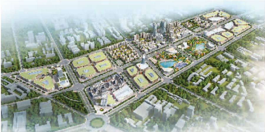
西华县特色商业区效果图

案，等待审批。另外，该县依据新修编的城乡总体规划(2016—2030)已启动西华县经济技术开发区及河西片区控制性详细规划，待总规批准实施后，该县将启动总规范围内高铁经济区、临空经济区、盘古女娲创世文化园区等重要片区的控制性详细规划，从而达到控制性详细规划全覆盖。一旦批准实施，将严格按照控规要求，指导西华县城市规划建设。 另外，西华县编制完成排水、公交、道路、园林、环卫、给水、燃气、供热、照明九项专项规划，且通过了专家评审并报西华县人民政府审批，其中排水专项规划已经政府批准实施。该县还启动了消防专项规划的编制，目前初步方案已完成。2017年该县新启动了西华县海绵城市专项规划、西华县地下空间开发利用专项规划、西华县地下综合管线专项规划、西华县地下综合管廊专项规划、西华县污水处理、再生水利用和污泥处置设施专项规划，这些项目已完成财政控制价评审工作，下一步将开展项目招标投标工作，从而推进此类项目规划编制进度。 城市总体规划将西华县的城市功能定位、产业发展、基础设施和生态环境建设等发展战略部署整体部署在一张蓝图上，将对西华县经济社会长远发展具有重要战略意义。 蓝图绘就，铿锵而行。西华县正激情高涨描绘着美好的明天！