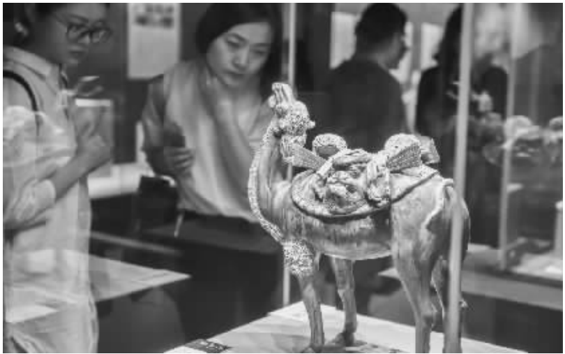
杭州西湖博物馆举办“唐三彩”精华展 4 月 25 日,观众在参观展品“三彩釉陶载物骆驼”。当日,杭州西湖博物馆与陕西历史博物馆、陕西省考古研究院、陕西唐三彩艺术博物馆联合推出的“一日看尽长安花——唐都长安三彩精华展”在浙江杭州西湖博物馆开幕,展出近百件唐三彩精品。

“然而,我们也应清醒认识到我国汽车产业还存在创新能力不强、部分关键核心技术缺失等问题。”苗圩说,规划提出了我国汽车产业未来 10 年的发展目标、重点任务和政策措施,核心要义是做大做强中国品牌汽车,培育具有国际竞争力的企业集团。新能源汽车和智能网联汽车将成为主要突破口,引领整个产业转型升级;措施上将继续优化产业发展环境,推动行业内外协同创新。 国家发改委产业协调司司长年勇表示,规划为我国汽车产业发展指明了前路和目标,此次规划的出台意义深远。