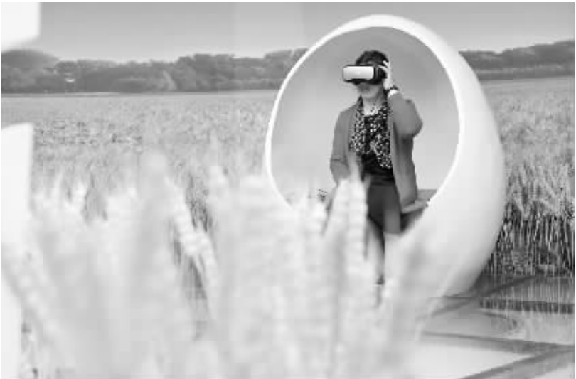
小麦博物馆里体验农耕文化 4 月 25 日,游客在河南温县的小麦博物馆用 VR(虚拟现实)设备感受麦收场景。河南温县小麦博物馆自 2016 年 5 月开馆以来,吸引了众多游客前来参观。

军委机关有关业务部门提醒广大士兵考生,文化科目考试大纲是由全军统一组织编修发布,指导士兵学员招生考试的唯一纲领性文件,是考试命题的规范和标准,也是考试评价和考生复习备考的指南。在大纲之外,业务部门未指定任何参考书目和复习资料。文化科目考试大纲从全军军事综合信息网“军队院校招生信息网”下载,网址为 www.zsxcw.mtm 。