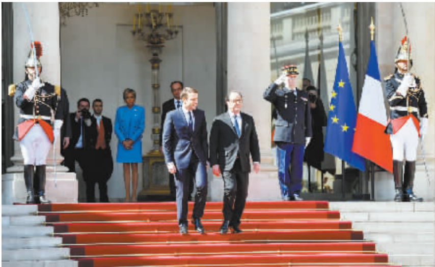
法国举行总统权力交接仪式

总统府一名不愿公开姓名的官员告诉新华社记者,李海瓚访华期间计划与中方人士就两国关系广泛交换意见,包括“萨德”问题和朝鲜半岛事务。据悉,李海瓚所率领的访华团还将包括国会议员、前驻韩外交官以及智库研究员等多名成员。