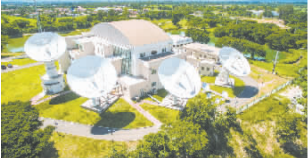
一带锦绣 万里宏图

这是老挝首都万象的老挝一号通信卫星地面站全景(2016年8月1日摄)。2015年11月,中国和老挝合作,在中国西昌卫星发射中心成功发射老挝一号卫星。2016年3月,卫星完成在轨交付,中老合资的老挝亚太卫星有限公司同时成立,负责卫星的商业运营。这是中国首个向东盟国家整星出口的商业卫星。湄公河畔,4台巨大的通讯天线通过这颗卫星为老挝以及整个中南半岛提供通讯和卫星电视服务。