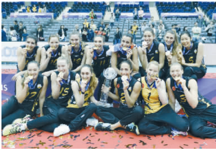
女排世俱杯:土耳其瓦基弗银行夺冠

1945年4月,美军占领冲绳。1972年5月15日,冲绳的施政权被正式交还给日本政府。