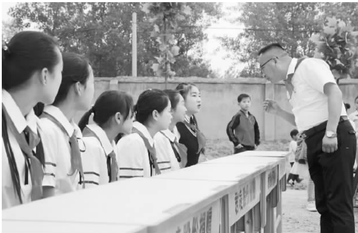
昨日,河南君凌股份有限公司为扶沟县吕潭乡宋寨小学捐赠了130套新桌椅。据悉,扶沟籍在外成功人士一直非常关心家乡教育,捐资助学已蔚然成风,从而有效地改善了当地的办学条件,为学生创造了良好的学习环境。图为该公司负责人正在了解学生的学习情况。

该校“一师一优课,一课一名师”工作领导小组组长张纯才要求,本次晒课活动要努力实现两个100%,即人人晒课,参与率达100%;晒高质量的课,每人至少晒一节完整度为100%的课。(师亚军)