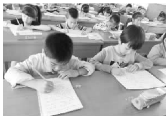
近日,周口市六一路小学举行了口算和晨诵背默比赛,全校共有420人参加了比赛。本次比赛的主题是“口算我最快、背默我最强”,采取笔试的方式分年级进行。图为参赛选手正在认真答题。