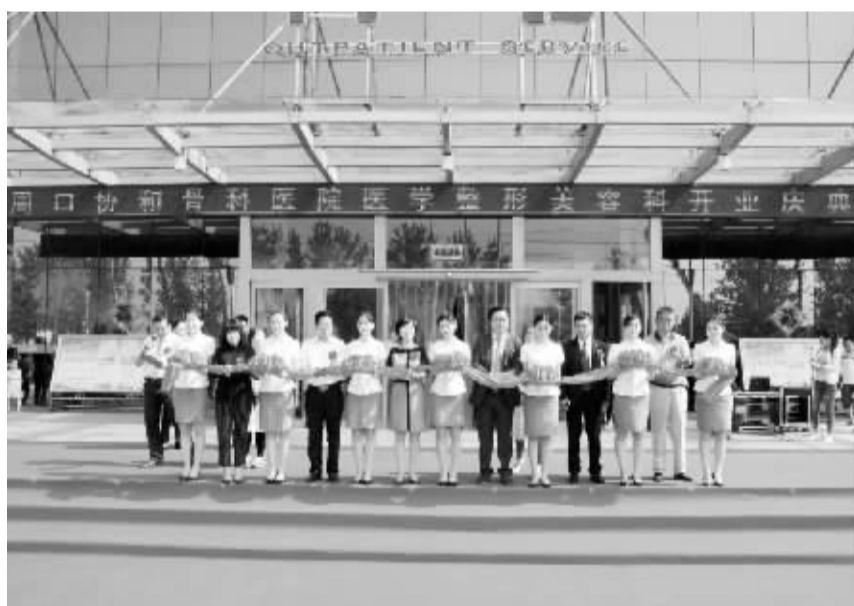
5月20日,周口协和骨科医院门前彩旗飘飘、锣鼓喧天,该院医学整形美容科正式成立。据了解,医学整形美容科设有门诊、美容咨询室、VIP休息室与光电治疗室,双层面无菌手术室配有进口无疼水光机、360度水动力减肥吸脂仪、进口PRP分离机等国内外先进设备,可全面开展日常美容和相关治疗。图为开业庆典现场。