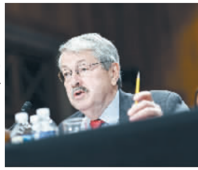
州长。他被广泛认为是对华友好的美国政界人士之一，美国总统特朗普去年 12 月提名他为下一任驻华大使人选。

布兰斯塔德现年 70 岁，1983 年至 1999 年以及 2011 年至今担任艾奥瓦州