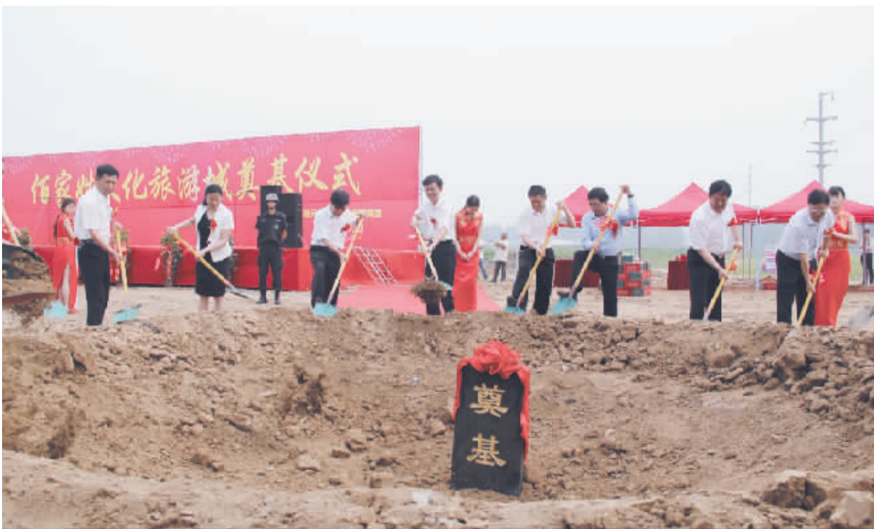
百家姓文化旅游城项目奠基现场。

据了解,翰高兄弟(北京)投资集团秉承“博文为翰,日则新高”的企业精神,以科技创新和文化创新为双引擎,以文化创意和文旅为双动能,已发展为融艺术建材、园林、地产、文旅为一体的综合性企业。该公司承接过2008年北京奥运村、2009年济南全运村、2010年上海世博会等