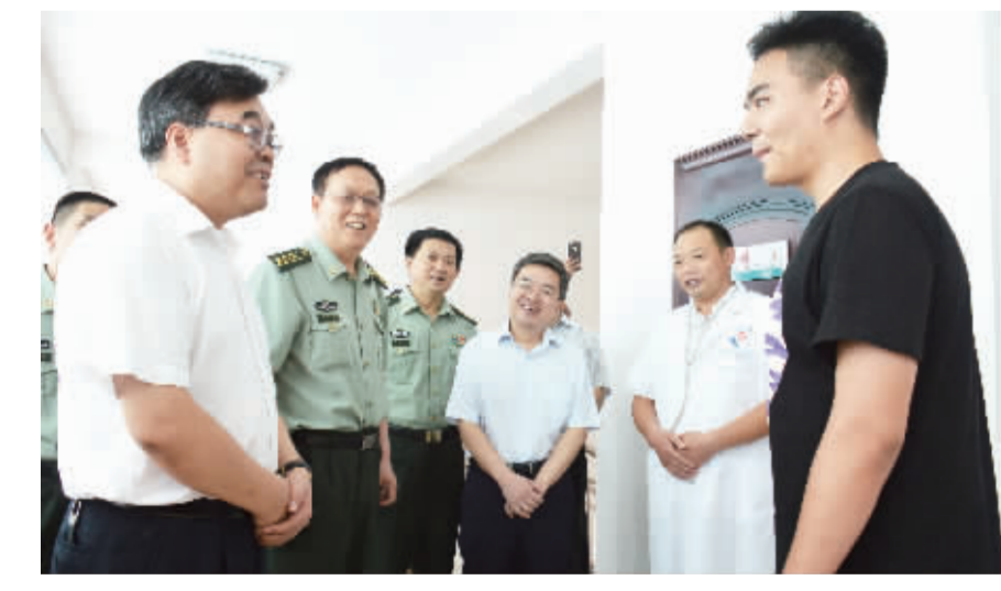
市委书记刘继标在沈丘县退役士兵服务中心调研。