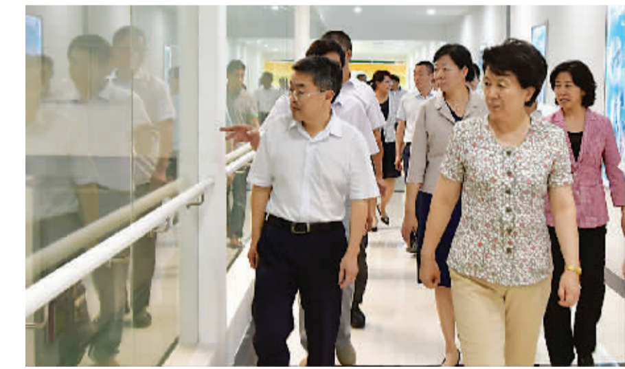
省委常委、宣传部长赵素萍深入沈丘县新华雪啤酒有限公司调研。