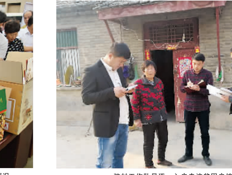
驻村工作队队员逐一入户走访贫困户核对信息。