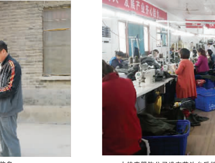
大雄鹰服饰公司设在莲池乡后胡行政村的扶贫车间里工人们正赶制服装。