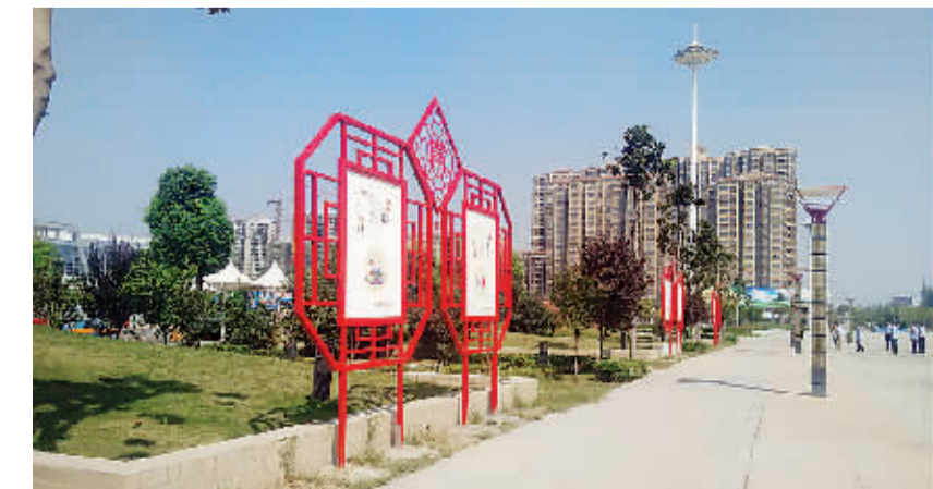
极具特色的公益广告宣传栏与干净整洁的火车站广场相得益彰

确实,每一个人心都有一个“文明城市”标准:谦和的市民、整洁的家园、清新的空气、安静的夜晚、有序的道路……三年文明创建,三年沧桑巨变,细心的您如今走上开发区的大街小巷,发现干净整洁的街道社区多了,乱画乱停的现象少了;礼让友善的多了,冷漠纠纷的少了;志愿者、爱心人士多了,各种不文明行为少了……这一切无不与开发区近几年坚持不懈地创建文明城市密切相关,这一切都是精细化管理城市结出的硕果。历经文明城市创建工作的洗礼,开发区正通过一步步建章立制、以创促建、精耕细作,不断丰富着文明城市的色彩与内涵,让一朵朵文明之花在辖区的角角落落绚丽绽放,城市品位跨上新台阶。