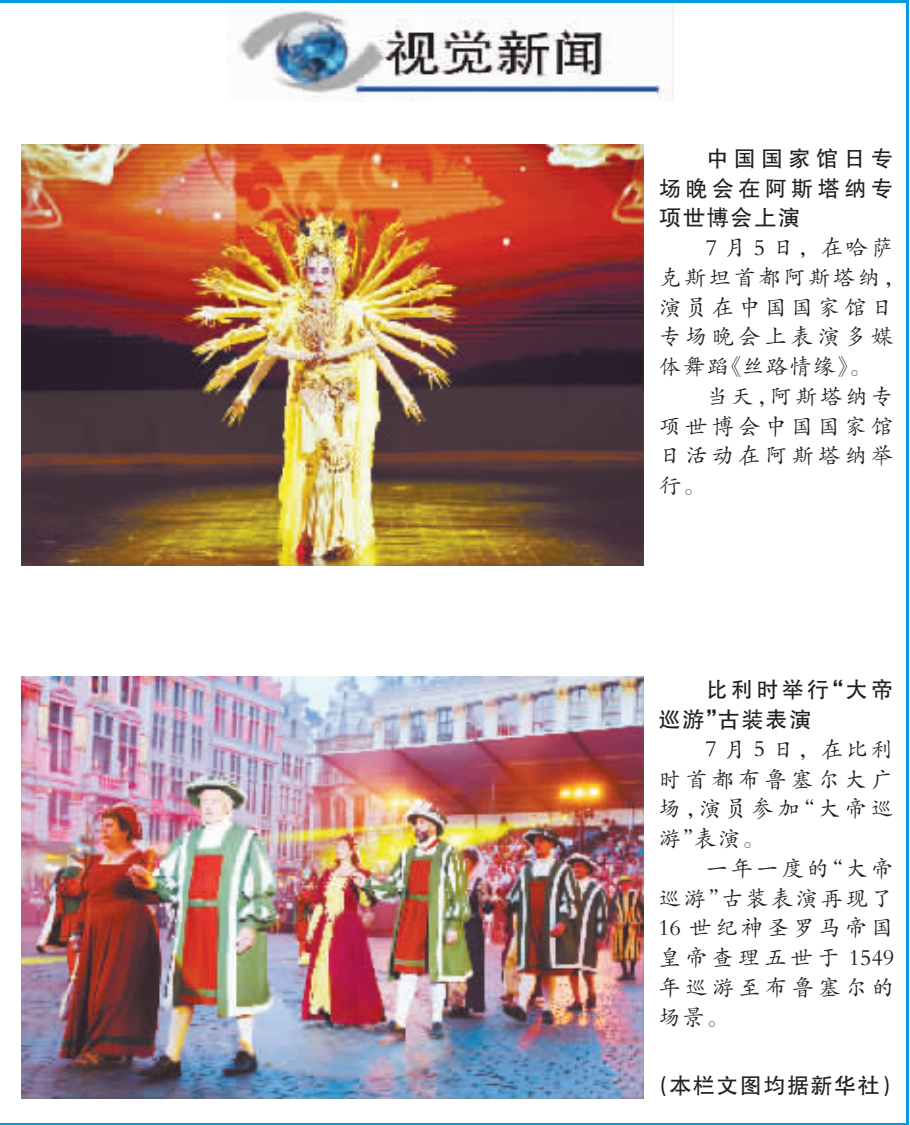
视觉新闻 中国国家馆日专场晚会在阿斯塔纳专项世博会上演 7 月 5 日,在哈萨克斯坦首都阿斯塔纳,演员在中国国家馆日专场晚会上表演多媒体舞蹈《丝路情缘》。 当天,阿斯塔纳专项世博会中国国家馆日活动在阿斯塔纳举行。 比利时举行“大帝巡游”古装表演 7 月 5 日,在比利时首都布鲁塞尔大广场,演员参加“大帝巡游”表演。 一年一度的“大帝巡游”古装表演再现了 16 世纪神圣罗马帝国皇帝查理五世于 1549 年巡游至布鲁塞尔的场景。