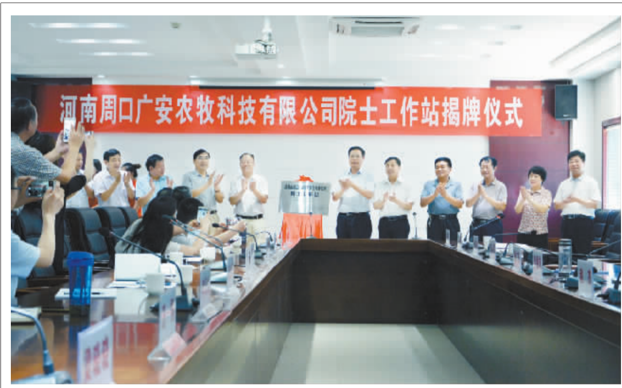
7月11日，河南广安农牧科技有限公司院士工作站在川汇区高新技术产业开发区正式挂牌成立。近年来，川汇区高度重视人才工作，持续推进科技兴区战略，围绕人才工作建立了政策体系，培养出一批高端技术人才，有效提升了全区科技创新水平。目前，高新区拥有国家级信息服务平台1个、院士工作站1个、博士工作站2个，省级以上研发机构、工程实验室、技术实验室15个，拥有150多项专利和科技成果。

照专项行动方案要求，进一步明确任务、明确职责、明确时限。各办事处要落实属地责任，充分发挥主力军作用。要继续坚持“一天一碰头、一天一督导、一天一汇总、一周一通报”工作机制，对执行不力、拖沓迟缓、工作棚架的，要给予通报批评、公开曝光、追究问责。针对整治工作中存在的困难和问题，指挥部及各相关部门要及时反馈，认真梳理汇总、及时研究解决，确保整治工作达到预期目标。 会上，副区长沈宗祥通报了全市第二批“两违”治理会议精神和川汇区第一批“两违”拆除情况，安排部署第二批“两违”集中整治拆除工作。 (理效明 王龙)