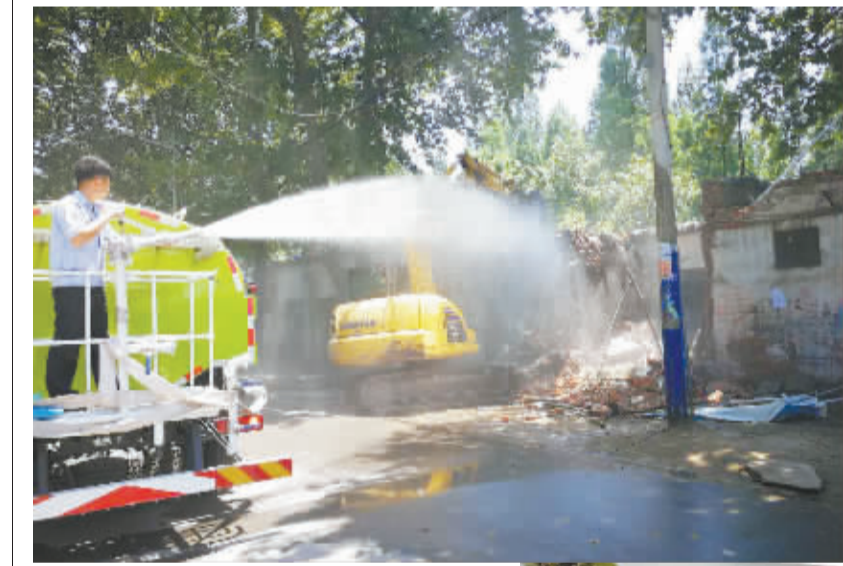
7月11日，川汇区对金海路办事处新村社区、张埠口行政村的38处4600平方米“两违”建筑实施集中拆除，全区声势浩大的“两违”整治攻坚战就此打响。