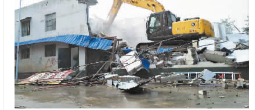
7月17日上午，川汇区举行第三次“两违”整治集中拆除行动，将金海路办事处前进社区44处违建依法拆除，面积达18000平方米，此次行动宣告川汇区全面完成滨河路两岸“两违”整治任务。