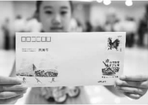
《北京成功申办2022年冬季奥林匹克运动会两周年》纪念封在京发布

程各类资金2600多亿元。其中,中央预算内投资393.6亿元,地方政府债约780亿元,专项建设基金约440亿元,中央财政贴息贷款1000多亿元,有效保障了工程建设资金需求。与此同时,各地牢固树立“搬迁是手段、脱贫是目的”的理念,将后期帮扶摆在更加重要的位置,进一步加大了后续帮扶力度。据初步统计,今年以来,各地已为110多万建档立卡搬迁人口谋划或实施了脱贫帮扶措施。