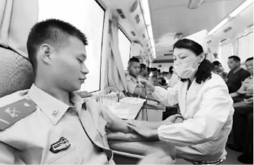
安徽淮北:献血迎“八一”

7月31日,消防战士在献血车上献血。当日,安徽省淮北市公安消防支队相山大队三堤口中队的官兵在营地参加无偿献血活动,以特殊的方式迎接“八一”建军节。