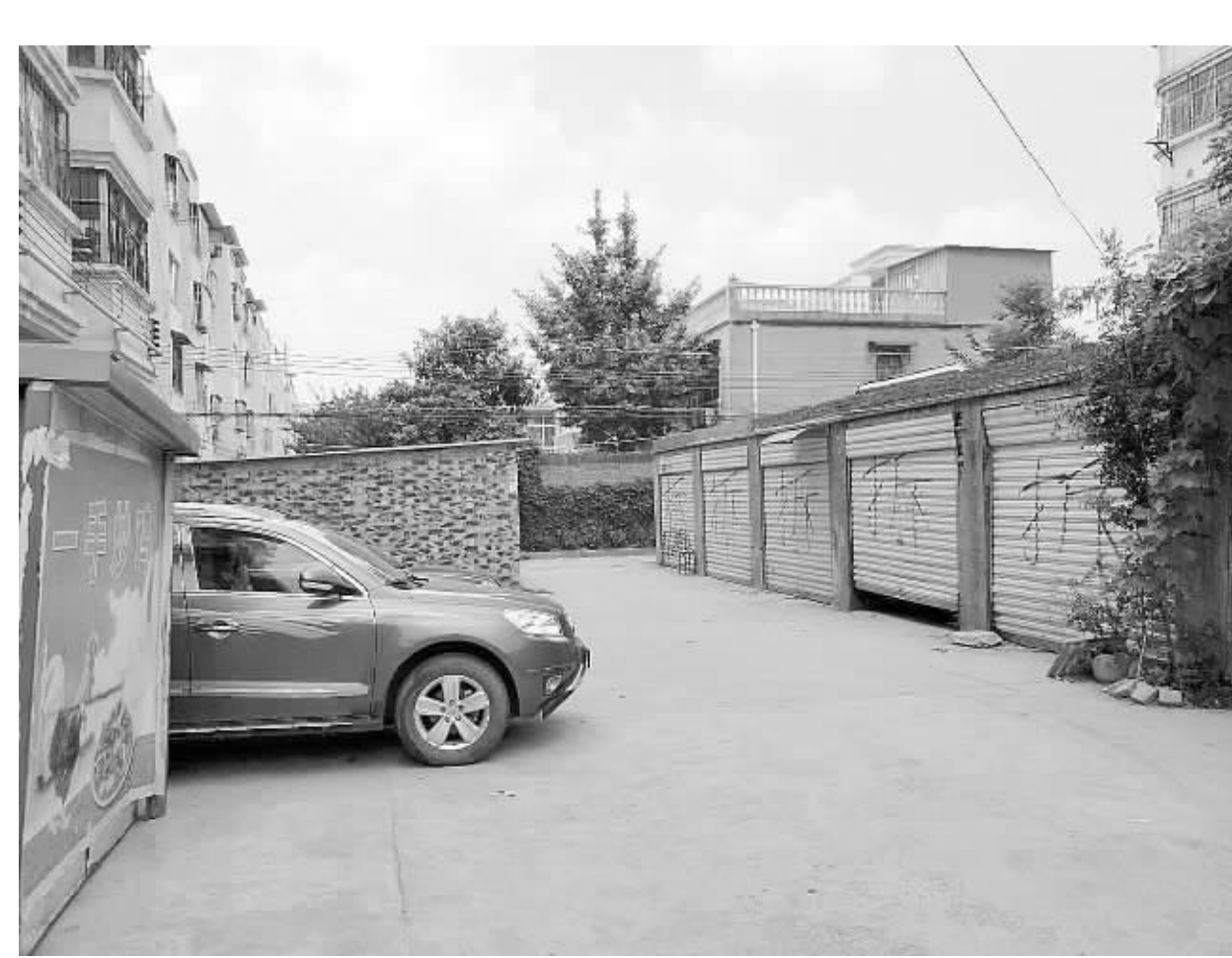
居民期盼尽快拆除家属院中“两违”