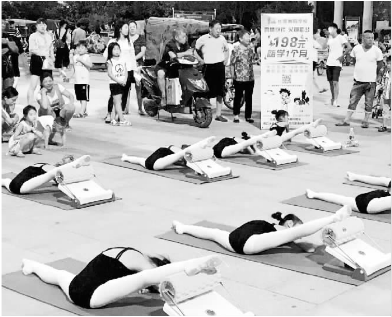
日前,东新区红霞舞校在周口公园展示团体训练项目。暑假期间,越来越多的孩子选择了参加舞蹈培训。跳舞能激发孩子的想像力、创造力,促进孩子的身体、智力综合发展。