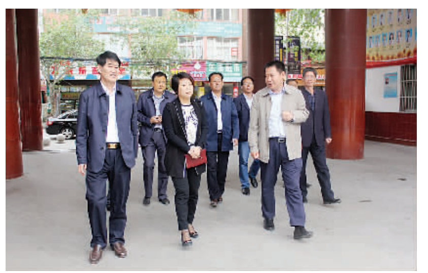
副县长高炜到实验中学慰问教师