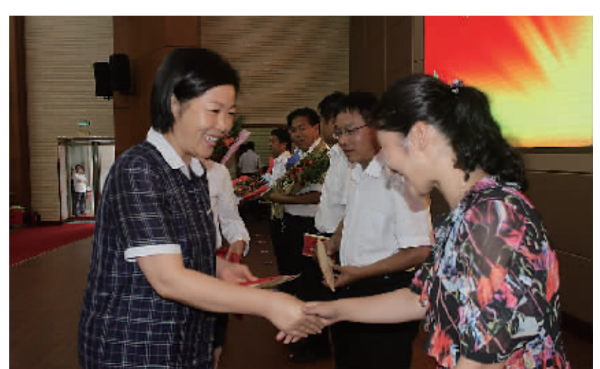
县委书记罗文阁为郸城一高优秀教师颁奖