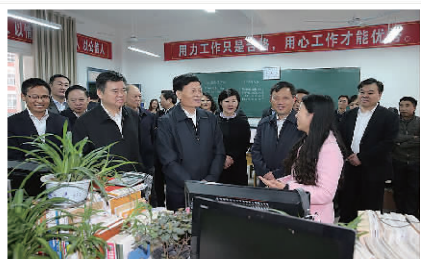
省委书记谢伏瞻亲切问候郸城一高教师