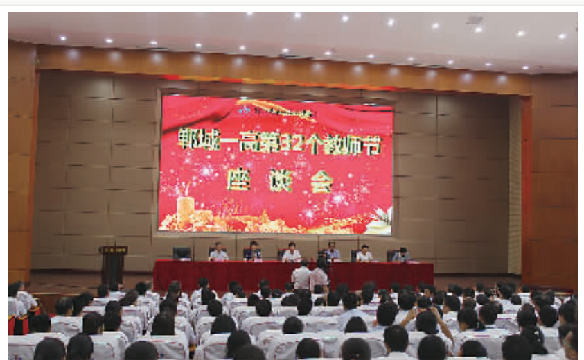
副省长徐光连续5年和郸城一高教师共度教师节

教师是立教之本、兴教之源。近年来，郸城县着力完善教师补充机制、强化教师培养培训、加强师德师风建设，多措并举激发教师爱岗敬业积极性，塑造了一支大美教师群体，夯实教育发展根基。