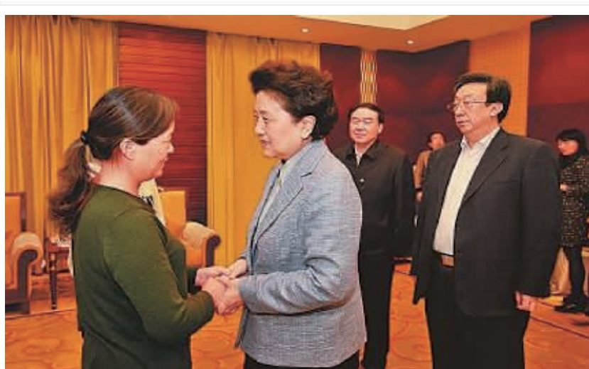
中共中央政治局委员、国务院副总理刘延东接见张伟家属