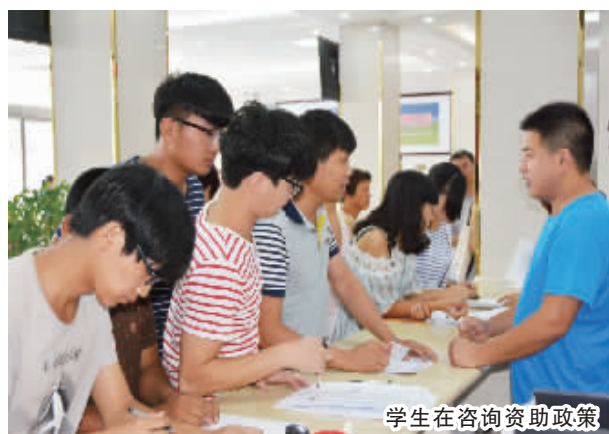
学生在咨询资助政策