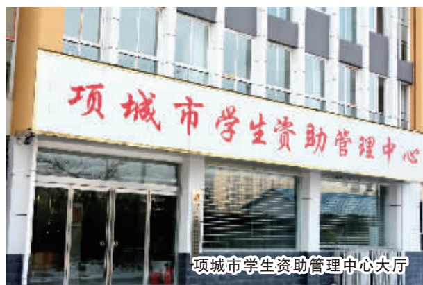
项城市学生资助管理中心大厅