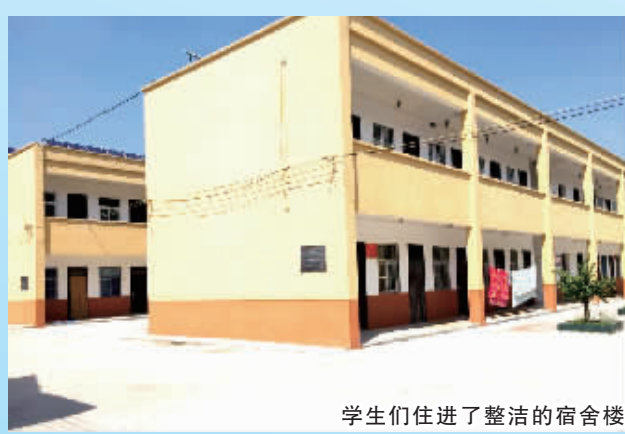
学生们住进了整洁的宿舍楼