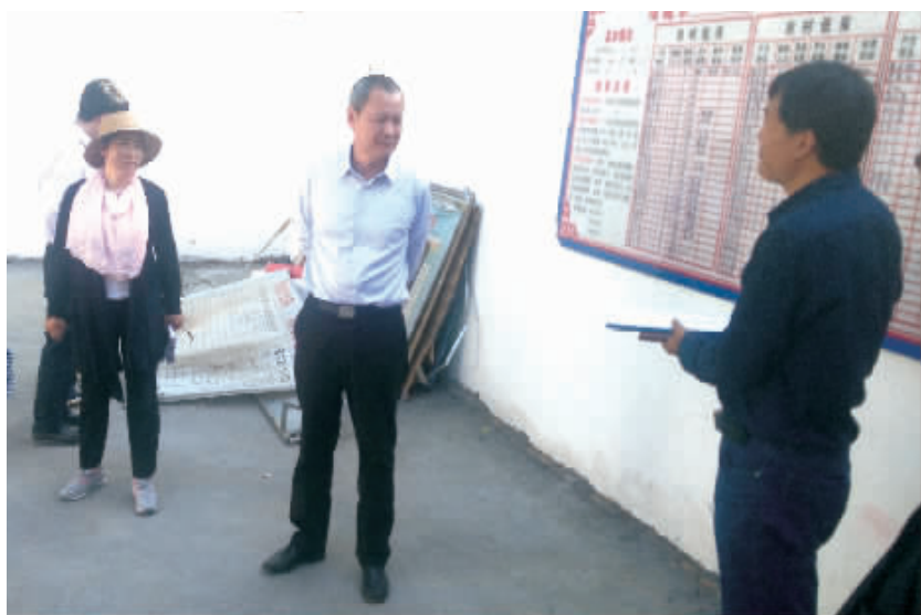
项城市委书记刘昌宇到马庄行政村指导教育脱贫攻坚工作