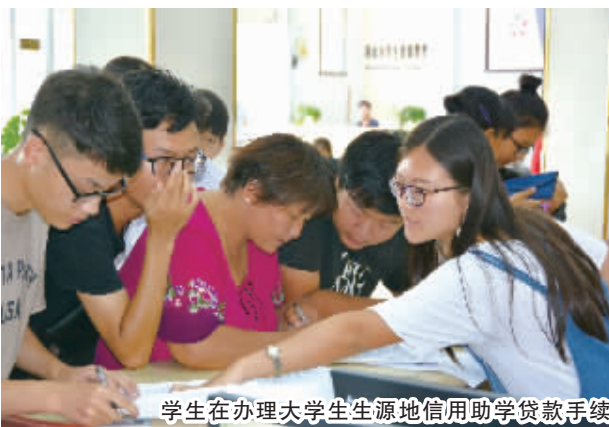
学生在办理大学生源地信用助学贷款手续