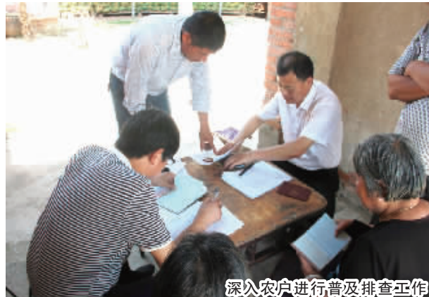
深入农户进行普及排查工作

习近平总书记强调,扶贫必扶智,授人以鱼不如授人以渔。治贫必先治愚,扶贫要先扶智,“富口袋”不如“富脑袋”。要让群众脱贫奔小康,就要不断注入“活水”,而智力扶贫就是这“源头活水”。