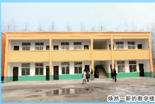
焕然一新的教学楼