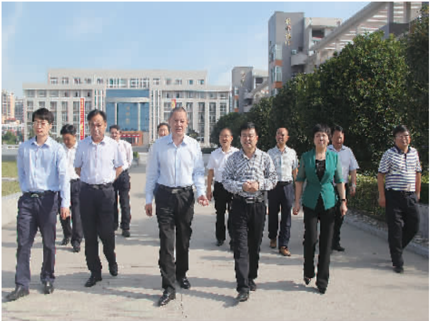
项城市委书记刘昌宇到校视察工作

回顾项城一高的发展,校长朱辉说:“项城一高的发展得益于各级党委政府和教育主管部门的关心和支持;得益于领导班子的团结协作;得益于全校师生员工锐意进取、扎实工作。”