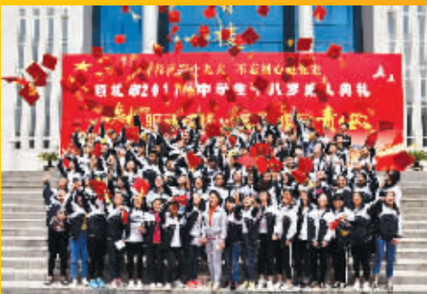
十八岁成人礼活动