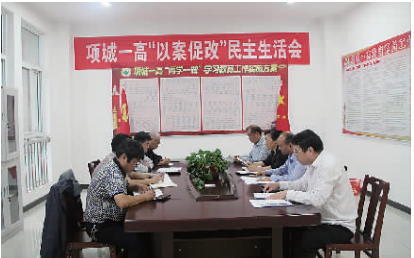
“以案促改”民主生活会