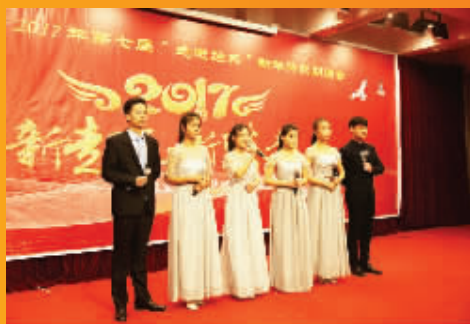
校园电台的学生集体诗歌朗诵