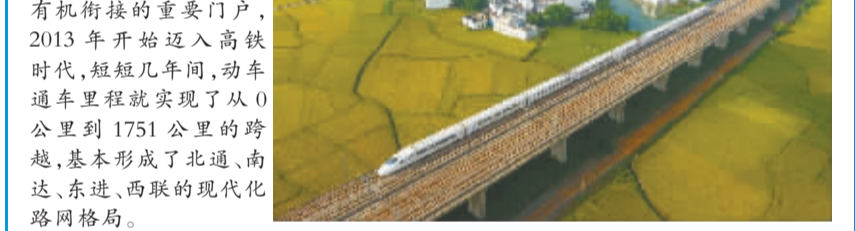
美丽高铁穿行山水画廊

这是9月25日在北京前门拍摄的花坛。国庆节即将到来,各式特色花坛陆续亮相北京街头,为首都增添喜庆气氛。