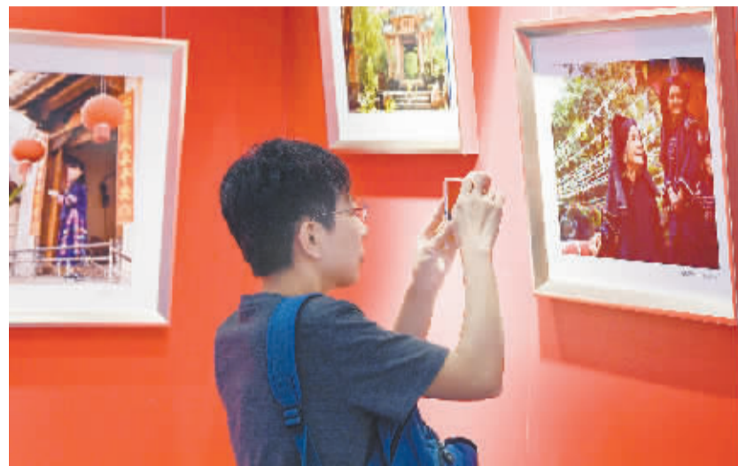
《牢记使命 繁荣文艺》首都文艺家创作采风作品展在京开幕 9月25日,《牢记使命 繁荣文艺》首都文艺家创作采风作品展在北京开幕。展览展出来自北京市文联系统的数十位艺术家的近百件作品,这些作品是 艺术家们深入到广西、云南等革命老区和少数民族地区,用绘画、书法、摄影等形式展现十八大以来这些地区发生的变化和当地特有的风貌。

下午4时,完成全部演习内容的中俄双方水面舰艇组成单纵队航行。随着俄舰鱼贯转向,舰艇告别仪式开始。中俄舰艇鸣笛致敬,双方舰艇分航,中方参演舰艇启程回国。