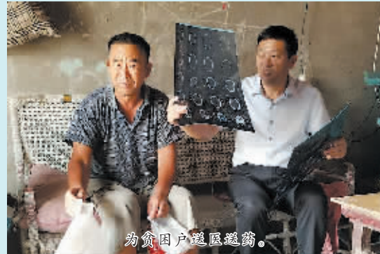
为贫困户送医送药。