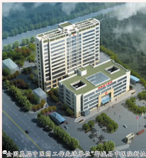
“全国基层中医药工作先进单位”郸城县中医院新址

杏林春色染社区，国药飘香进万家。中医药这一国之瑰宝的传承与创新，架构了郸城经济、社会和谐发展的新蓝图，为郸城卫生事业发展开创了百花绽放的新阶段。在国粹医学的精神指引下，我们相信，郸城中院人一定会续写新的神话，谱写更为高昂更为恢弘的壮美乐章！