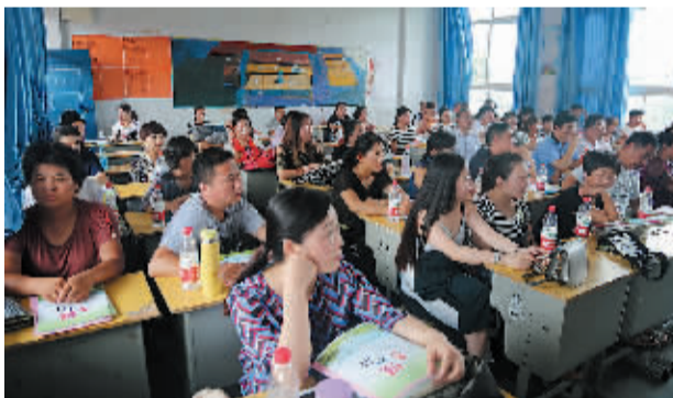
每学期两次的家长会