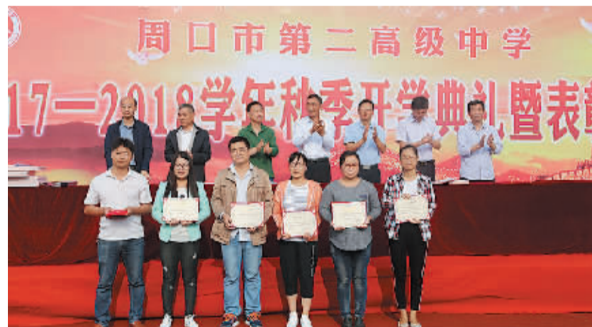
优秀教师和校长合影留念