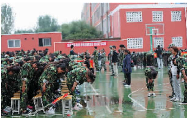
感恩师长教育活动