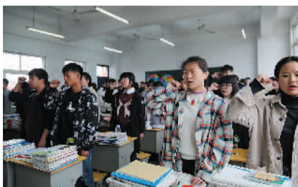
学生每天三次的课前宣誓