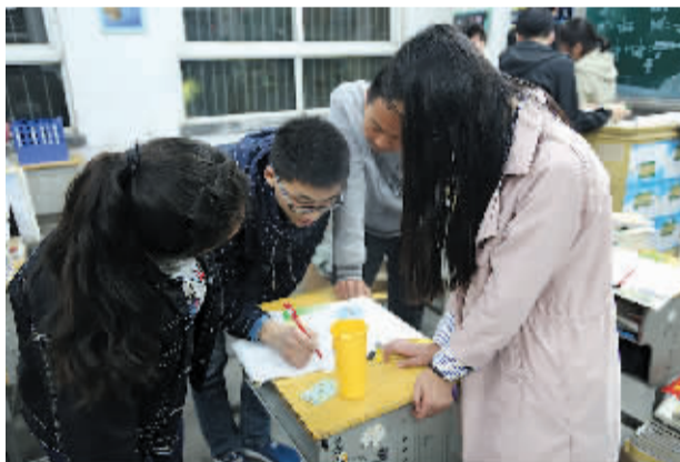
学生们进行小组讨论