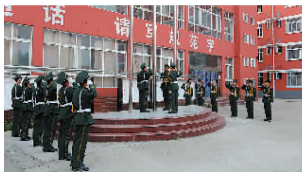
每周举办的升旗仪式