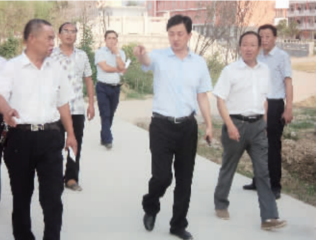
县委书记林鸿嘉到西华一高调研