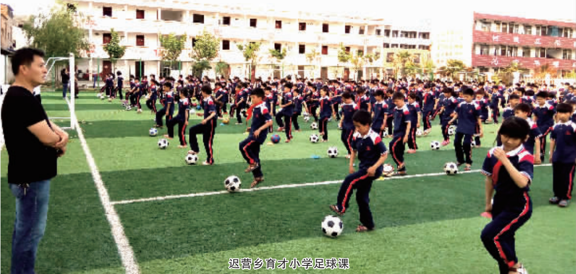
迟营乡育才小学足球课