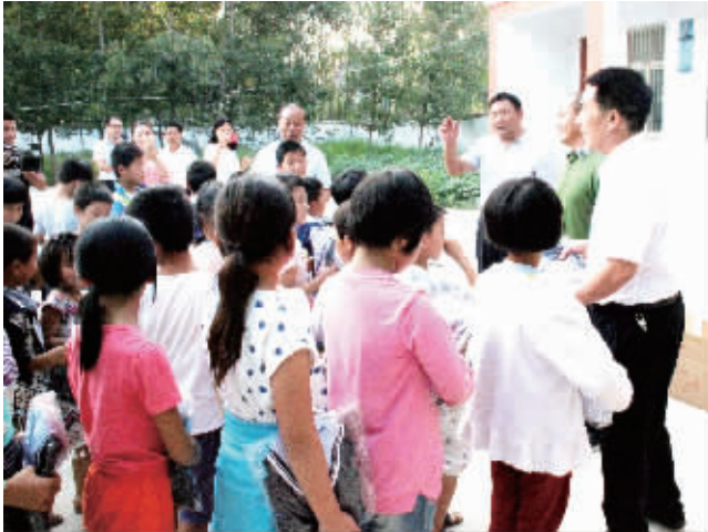
县教体局联系爱心企业为农村小学献爱心

“教育扶贫是阻断贫困代际传递的治本之策。”西华县主管教育的副县长张翠霞说。教育脱贫是最稳固、最有生命力的减贫方式,它更注重“造血”能力和内生动力培育的可持续性扶贫脱贫。