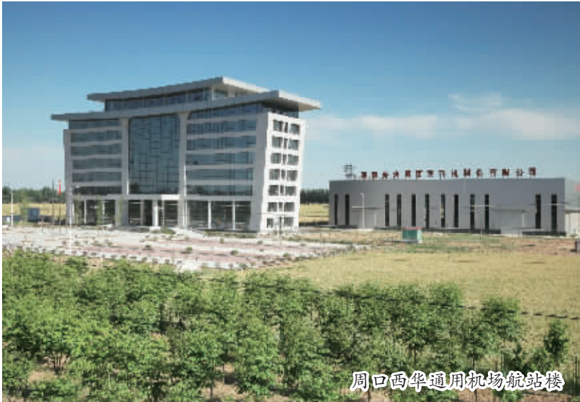
周口西华通用机场航站楼

数字印证发展:今年上半年,全县实现生产总值92.5亿元,同比增长8.6%,高于全市0.3个百分点。规模以上工业企业增加值同比增长7.9%。一般公共预算收入完成3.83亿元,同比增长12.6%,高于全市0.5个百分点。其中,税收收入完成2.2亿元,同比增长55.2%,增幅居全市第一位;工业税收达到4775万元,比上年同期增长125.7%,增幅居全市第二位。一般公共预算支出完成26.9亿元,同比增长28.6%,增幅居全市第四位。