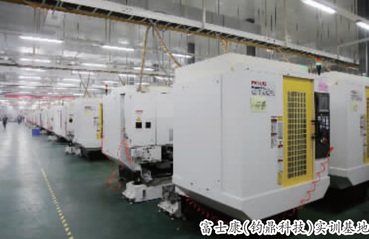
富士康(钧鼎科技)实训基地