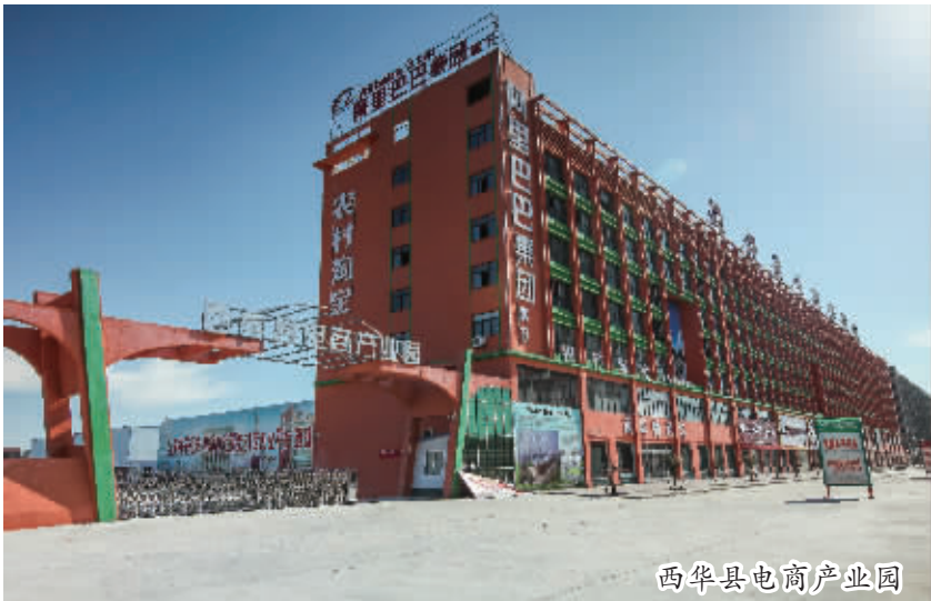
西华县电商产业园