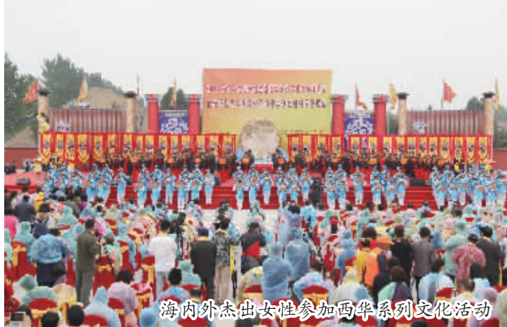
海内外杰出人士参加西华系列文化活动