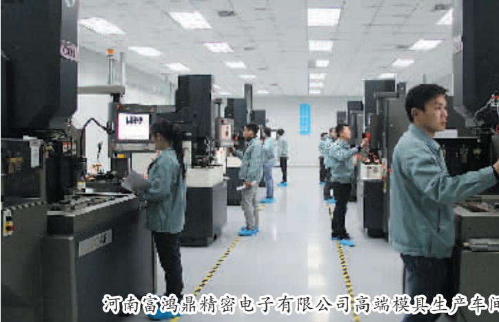
河南钧鼎精密电子有限公司高端精密生产车间