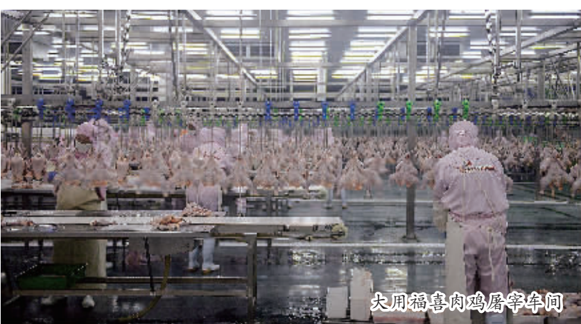
大用穆事内鸡房羊车间