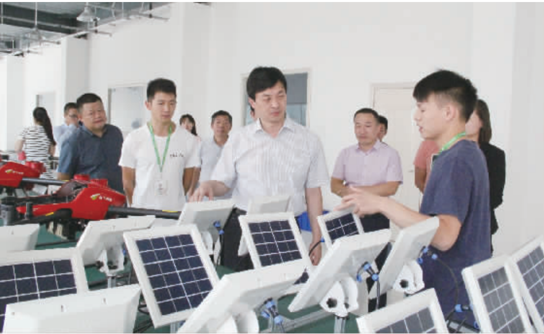
县委书记林鸿嘉到无人机产业园生产车间调研