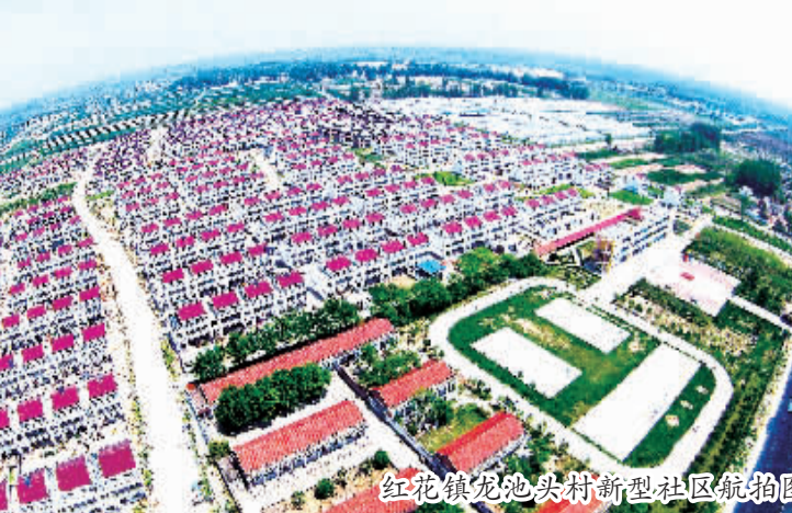
红花镇龙头村新型社区规划图