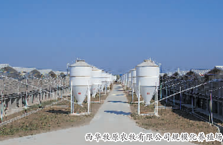
西华牧原农牧有限公司规模化养羊场