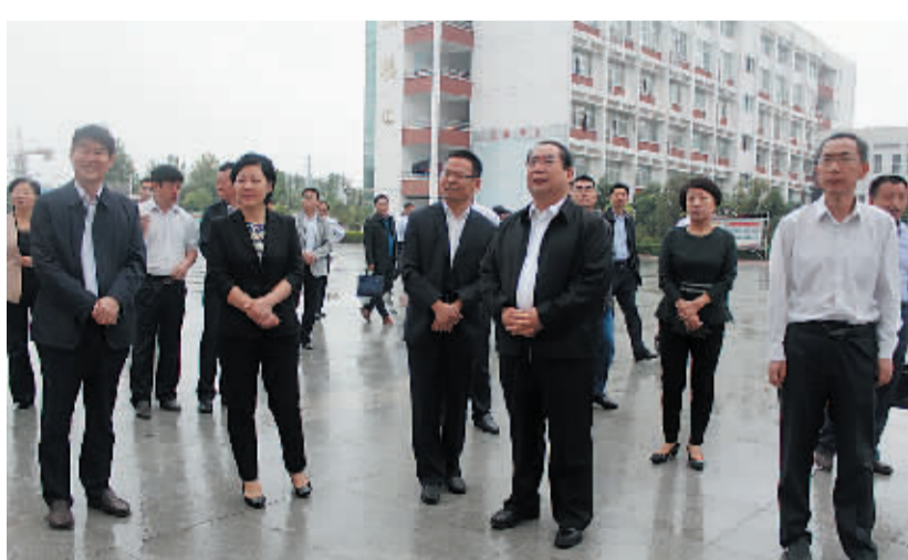
市长福浩到郸城调研教育工作