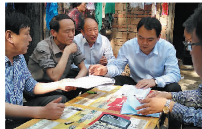
县长李全林到贫困户家中调研