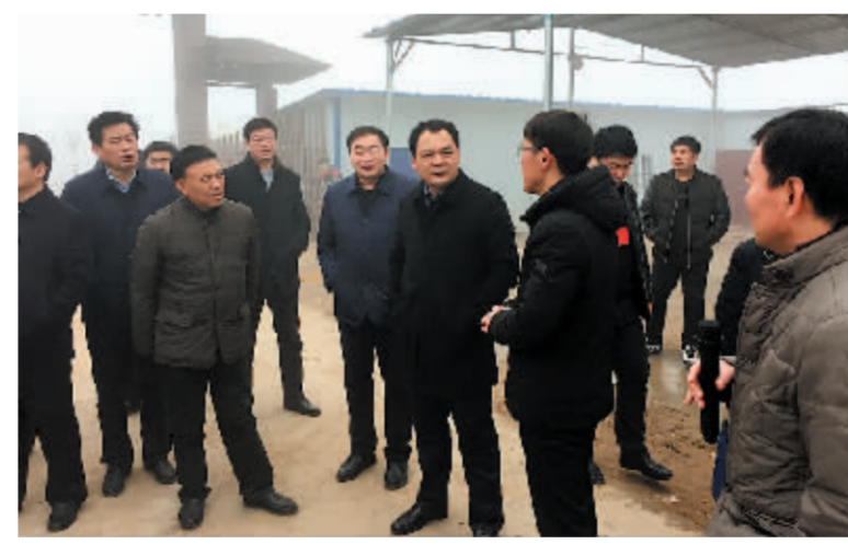
县长李全林到胡集乡万丰源扶贫基地检查指导产业扶贫工作