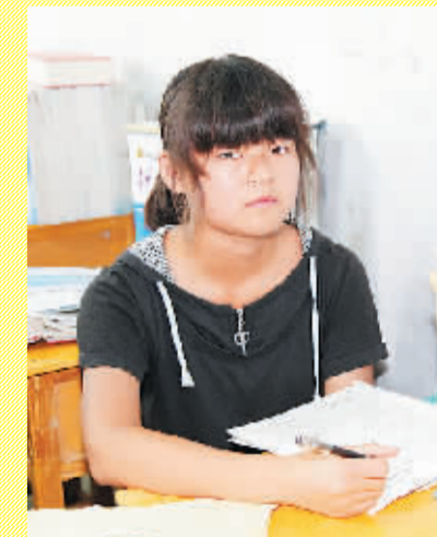
全国道德模范提名奖获得者谢宇慧