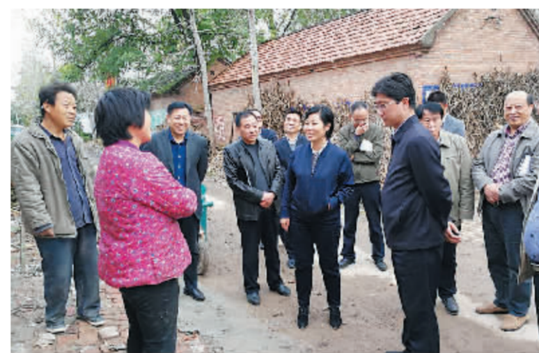
县委书记纪继标调研指导脱贫攻坚工作