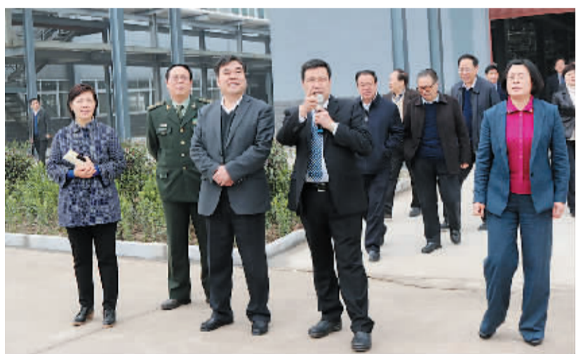
市委书记纪继标到郸城巨鑫生物有限公司调研项目建设