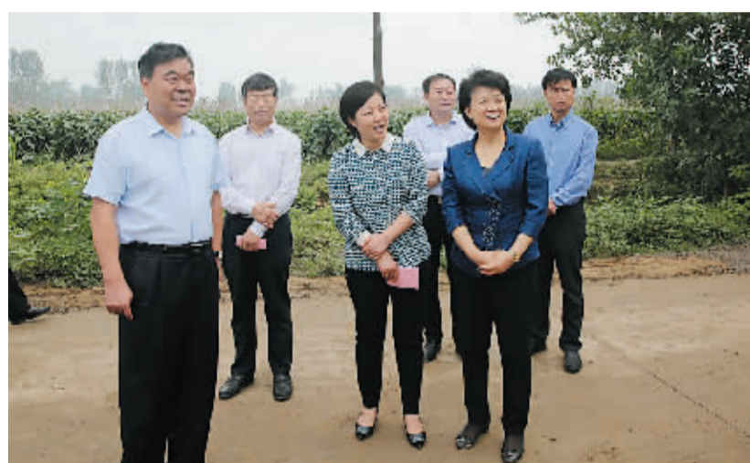
省委常委、宣传部长赵素萍到郸城调研脱贫攻坚工作