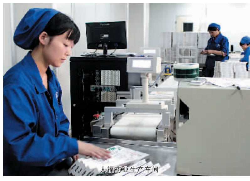
人福药业生产车间