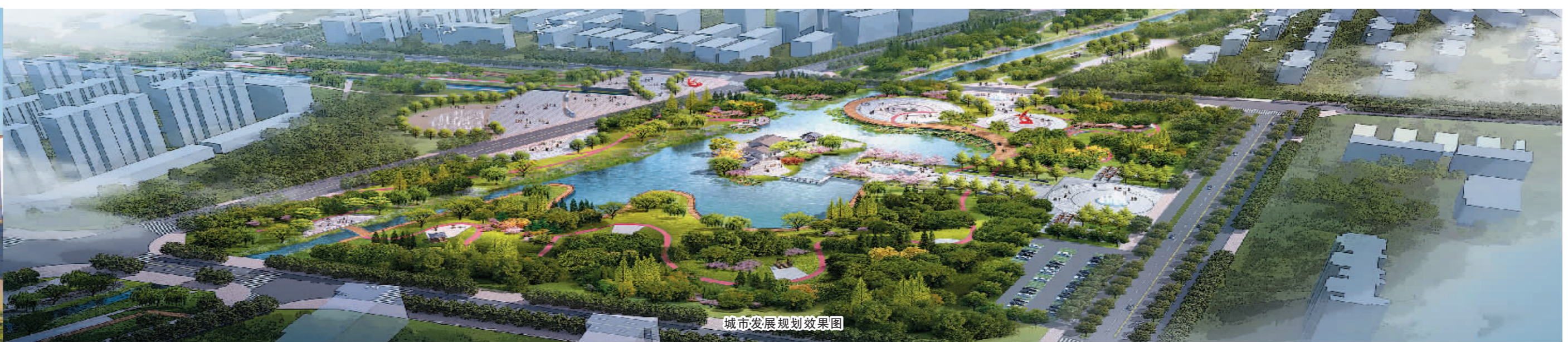
城市发展规划效果图