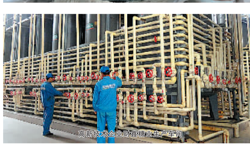
高新技术企业的现代化生产车间