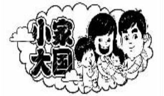
周晓梅绘制 王成俊