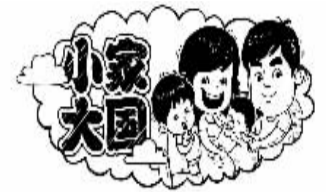
周晓梅绘制 王成俊