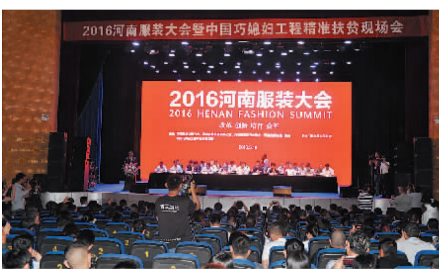
2015年5月19日，河南服装大会暨中国“巧媳妇”工程精准扶贫现场会在商水县召开。