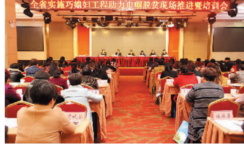
2016年11月15日，全省实施“巧媳妇”工程助力中帼脱贫现场推进暨培训会商水召开。

立足凝聚工作合力，探索引领产业发展 “巧媳妇”工程作为商水县产业发展的重要载体，由于各级各部门担任职务不同，思想认识各异，推进过程中不可避免地存在各种阻力。为加强组织领导，该县坚持把“巧媳妇”工程产业发展作为检验干部作风的试金石，强化基层执政能力建设的主战场，狠抓干部作风转变。