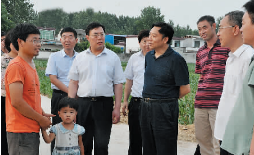
6月29日至30日，副省长张维宁到联系点商水县调研指导脱贫攻坚工作。