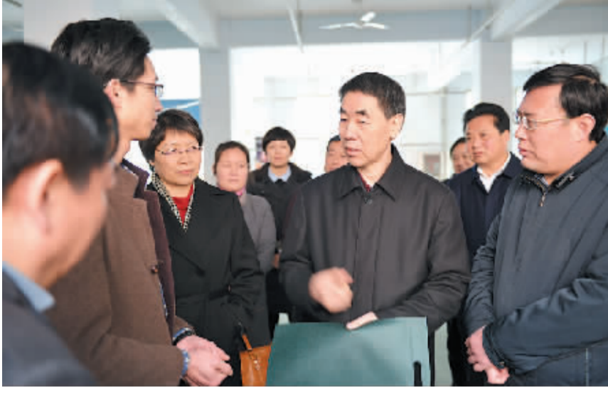
2月9日下午，副省长王铁到商水县调研“巧媳妇”工程推进脱贫攻坚工作。