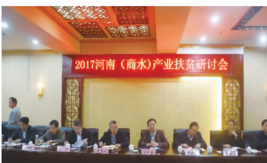
10月17日，2017河南(商水)产业扶贫研讨会在商水县召开。