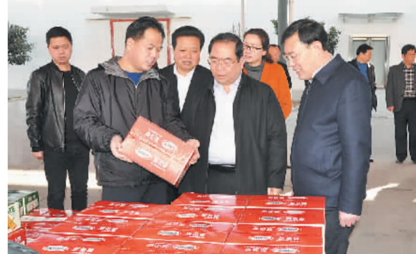
3月8日，市长丁福浩到商水调研脱贫攻坚建设情况。