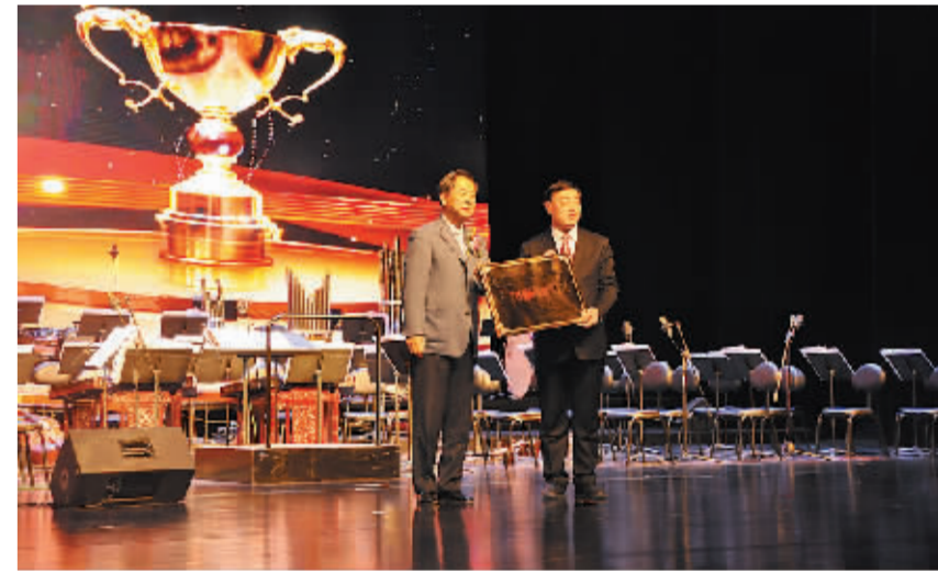
2016年1月，商水县被中国“巧媳妇”工程产业扶贫联盟和河南省服装行业协会共同命名为全国“巧媳妇”工程建设唯一示范县。