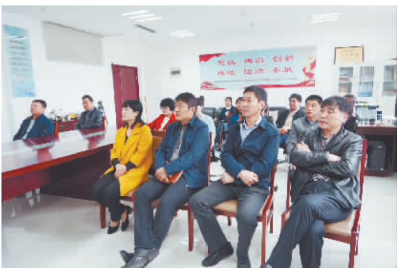
项城市委宣传部组织机关党员干部收听收看十九大开幕会。