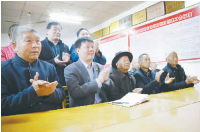
高寺镇党委组织党员干部收听收看十九大开幕会。

10 月 18 日上午,项城市组织各级各部门及社会各界群众收听收看了党的十九大开幕会盛况,认真聆听十九大报告。图为项城市委常委一起收听收看十九大开幕会。