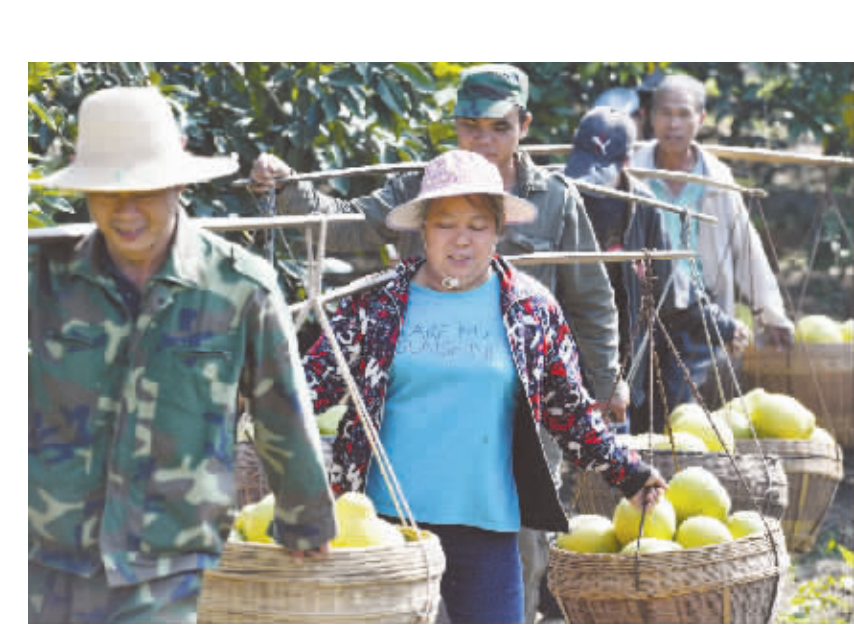
金秋苗山“柚”丰收 在广西融水苗族自治县国营贝江河林场的糯米柚基地里,工人挑着刚刚采收的糯米柚,准备装车(10月31日报)。 金秋时节,广西融水苗族自治县1.6万亩的糯米柚进入收获季节,果农们利用好天气采收柚子,预计今年该县糯米柚产量约2.4万吨。 新华社发

新华快递 商务部发布《长江中游区域市场发展规划》 据新华社武汉 11 月 1 日电(记者 俞俊) 商务部 1 日在武汉发布《长江中游区域市场发展规划》(2017-2020 年),将依托湖北、湖南、江西三省区位优势,抢抓“一带一路”建设、长江经济带发展等战略机遇,将长江中游区域打造成为全国重要的商贸物流枢纽。 规划提出到 2020 年主要实现的具体目标:一是城乡消费规模明显扩大,社会消费品零售总额达到 5 万亿元左右,年均增长 10%;二是现代化水平明显提升,电子商务交易额达到 5.3 万亿元左右,年均增长 15%,绿色消费占比扩大;三是企业竞争力明显增强,培育