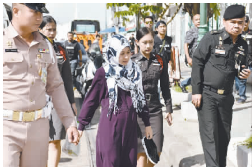
泰国警方逮捕一名四面佛爆炸案嫌疑人 泰国警方22日在曼谷素万那普机场逮捕一名2015年四面佛爆炸案女性嫌疑人。

勒文表示，贸易提高了全球生活水平，并让数以百万计的人脱贫，但过去几十年里不平等差距增大，财富越来越集中等现象，使经济形势从长期来看陷入不稳定局面。作为当今世界的重要挑战之一，缩减不平等差距已成为广泛的国际共识。