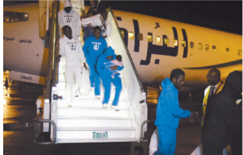
166名科特迪瓦非法移民从利比亚被遣返回国 11月22日，从利比亚返回的科特迪瓦非法移民抵达科特迪瓦阿比让机场。科特迪瓦政府于当地时间22日晚间发布消息说，第二批166名科特迪瓦非法移民已从利比亚回国。美国媒体

美国空军曾证实，凯利服役期间因家暴获罪，空军未按规定告知联邦调查局相关情况，其暴力前科因此未被录入相关数据库，从而顺利通过购买枪支的背景审查。