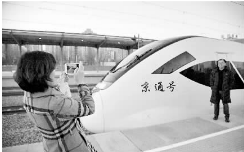
北京市郊铁路城市副中心线正式开通。2017年12月31日,乘客在停靠在北京东站的“京通号”列车旁留影。当日,北京市郊铁路城市副中心线正式开通,该线西起石景山衙门营站,东至通州站,全长38.8公里。此次先期开通北京西、北京、北京东和通州4站,从北京西站到通州站运行时间约48分钟。

珠澳大桥犹如一条彩练,将茫茫大海划成两半,蜿蜒绵亘伸向远方。港珠澳大桥管理局副局长余烈说:“三座通航孔桥似粒粒‘珍珠’,海中两座隧道人工岛宛如一对‘璧玉’,吻合大桥‘珠联璧合’的总体设计理念。” 全长55公里的港珠澳大桥是世界最长的跨海大桥。其中,工程量最大、技术难度最高的集桥—岛—隧于一体的主体工程,分别由22.9公里的主体桥梁和6.7公里的隧道与人工岛构成。“接下来1个月将推进整个工程设施设备系统的联调联试,完善项目验收等程序。待口岸工程竣工移交海关、边防等职能部门后,大桥便可投入试运营。”港珠澳大桥管理局工程总监张劲文说。