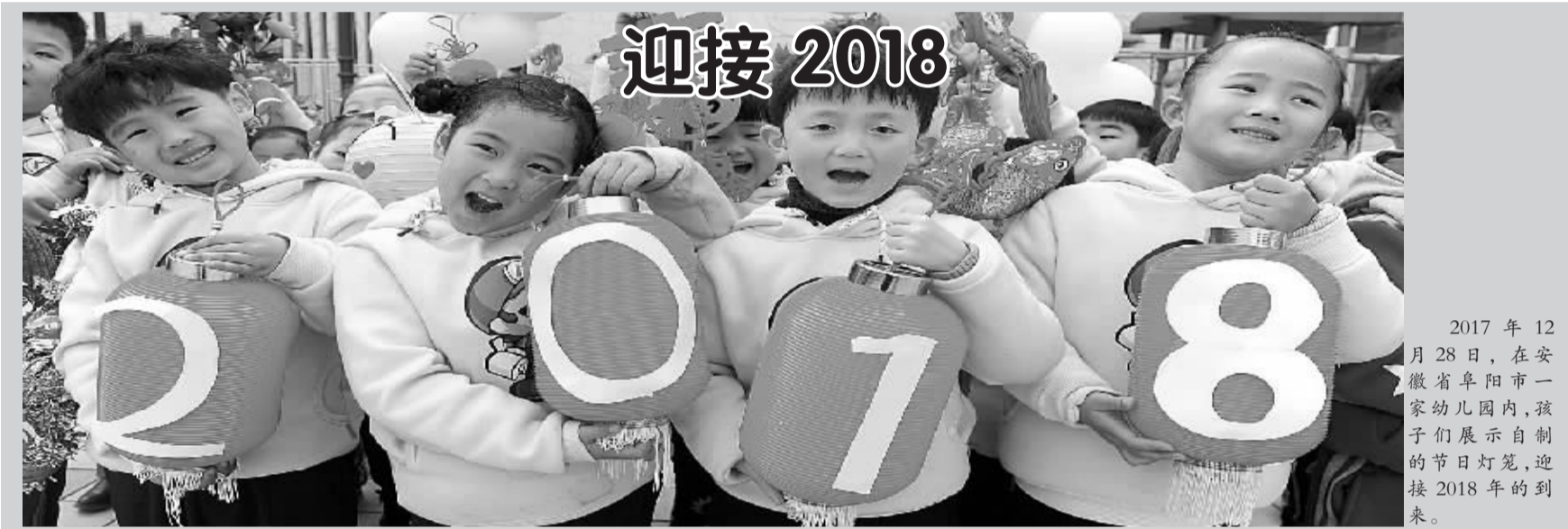
2017年12月29日,在江苏省常州市钟楼区科技幼儿园,一名老师在教室里悬挂写有“2018”字样的灯笼,迎接2018年的到来。

群众大病补充医疗保险制度,是在基本医保、大病保险之后,对困难群体医疗费用给予的再次报销。大病补充医疗保险保障对象包括建档立卡贫困人口、特困人员救助供养对象、城乡最低生活保障对象以及困境儿童等4类人群。截至2017年11月底,河南省困难群众享受大病补充医疗保险待遇55万人次,支付资金8.6亿元,大病补充医疗保险在基本医保、大病保险的基础上,实际报销比例提高了108.9%,切实减轻了困难群众大病医疗费用负担。