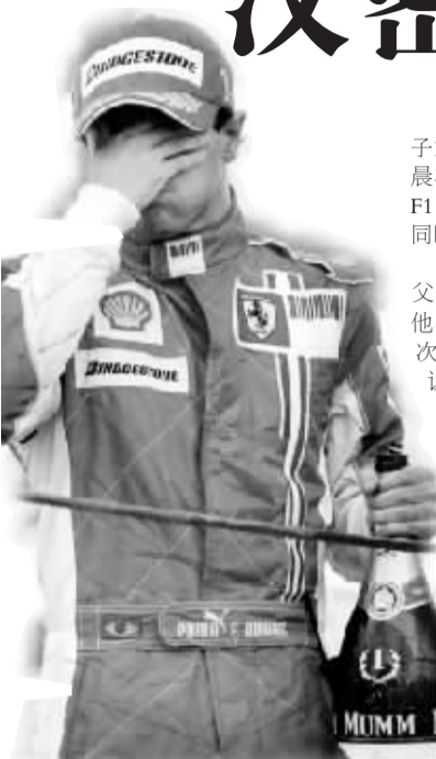
汉密尔顿(右)去年的痛楚昨天全转移到马萨身上

本报综合消息 23岁的英国黑人小子刘易斯·汉密尔顿,北京时间昨天凌晨在巴西英特拉各斯赛道加冕,成为了F1车坛有史以来第一位黑人世界冠军,同时也是有史以来最年轻的世界冠军。