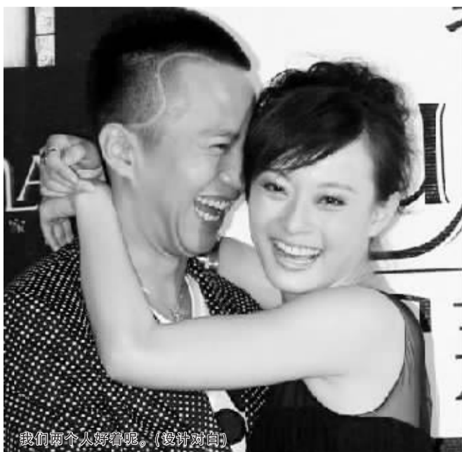
我们两个人好好着呢。(设计对白)

本报综合消息 近日,有媒体报道邓超孙俪濒临分手。该报道日前孙俪出席活动闭口不谈感情事