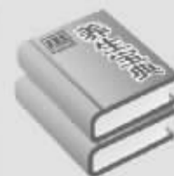
杨启彪博士亲自著作:《健康长寿的奥秘》

健康热线:8271218 地址:周口专卖(六一一路迎宾馆大门北10米)、项城水宜生专卖(莲花宾馆大门口向西100米祥福茶庄)、同和堂大药房(七一东路)、周口饭店(咖啡厅)、一峰超市二楼家电部、开心人大药房、西华天福茶庄(财政局斜对面)、鹿邑县鹿邑茶庄(县委对面)、郸城县世界名烟名酒行 诚招县市专卖店代理商 电话:13323948172