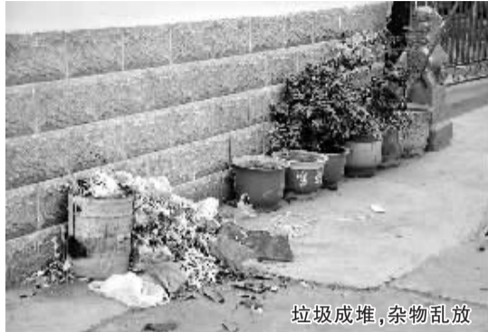
垃圾成堆,杂物乱放