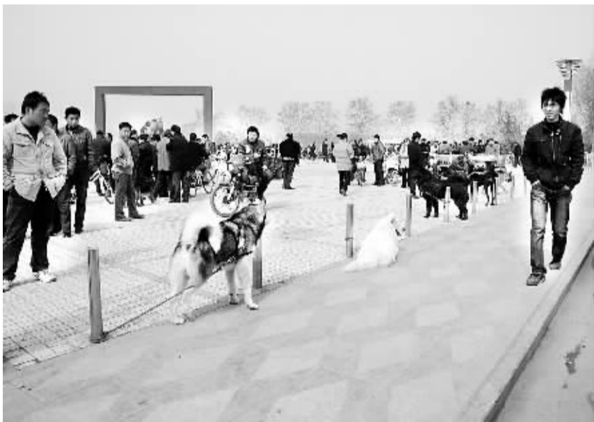
有的商贩甚至把一些体形较大的狗拴在滨河公园的小树上、栏杆上。