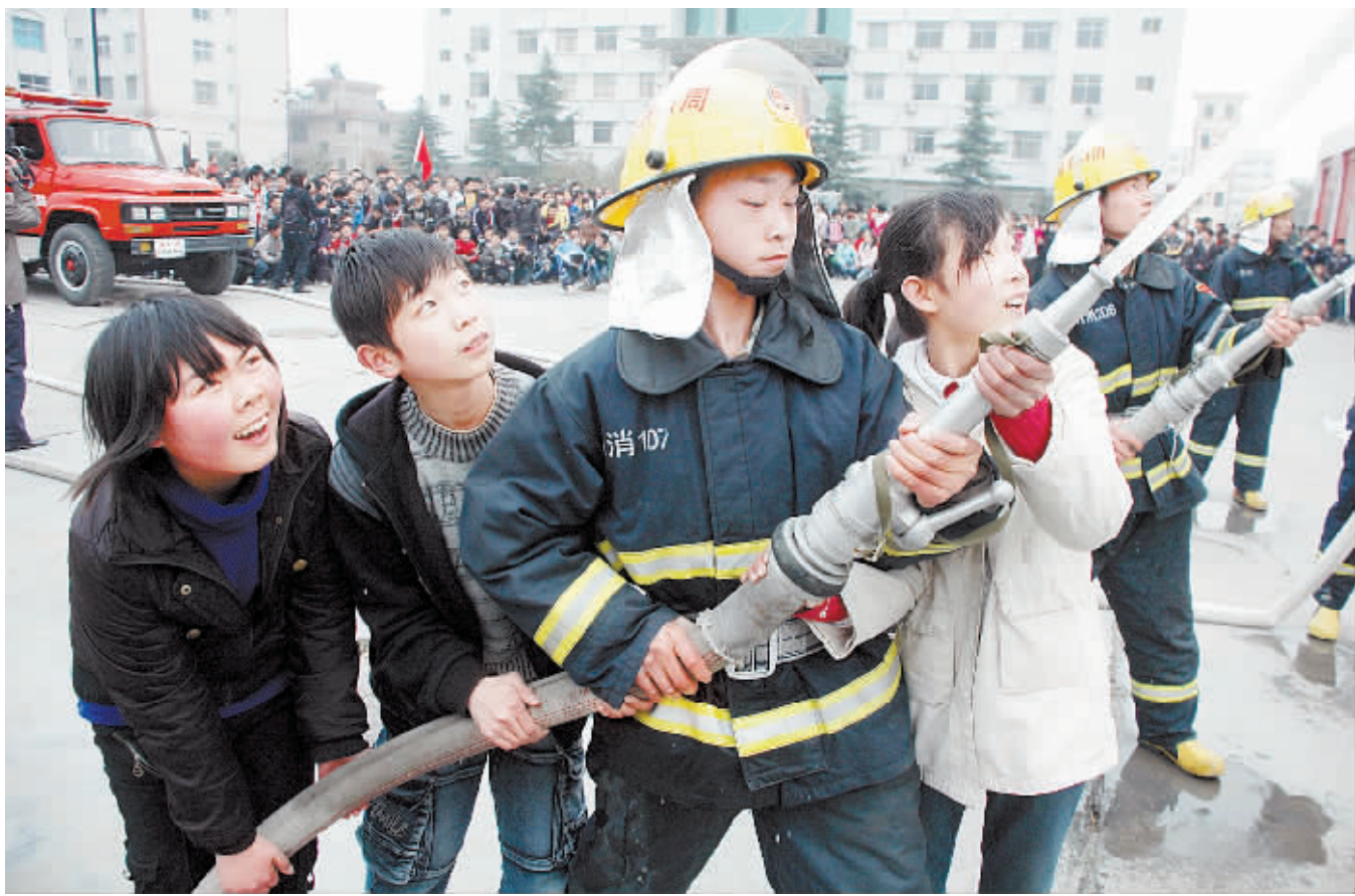
昨天下午,周口市消防支队迎来市区一所中学的近千名学生,他们通过一下午时间的参观、学习和体验,学到许多消防知识,也了解到消防官兵的辛苦。图为学生在学习怎样使用水枪。