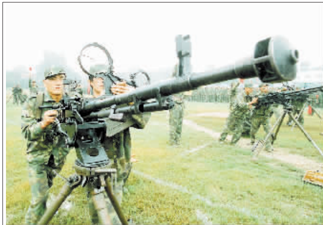
我市民兵进行防空训练 四版