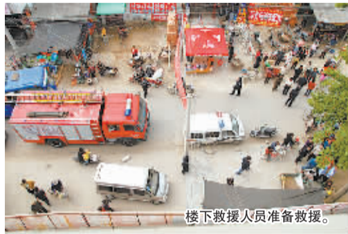
楼下救援人员准备救援。