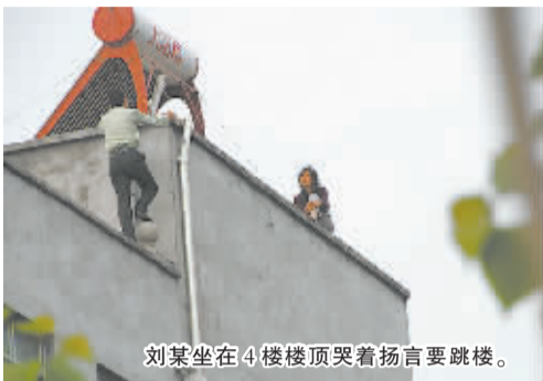
刘某坐在4楼楼顶哭着扬言要跳楼。