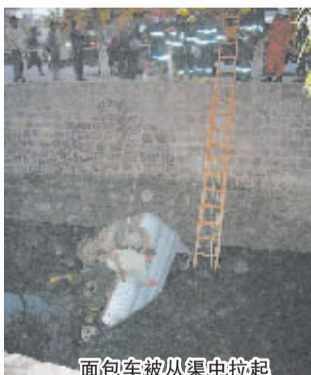
面包车被从渠中拉起

中的3人非常幸运,仅有一名男孩受了轻伤,均无生命危险。事故具体原因,交警部门正在调查之中。