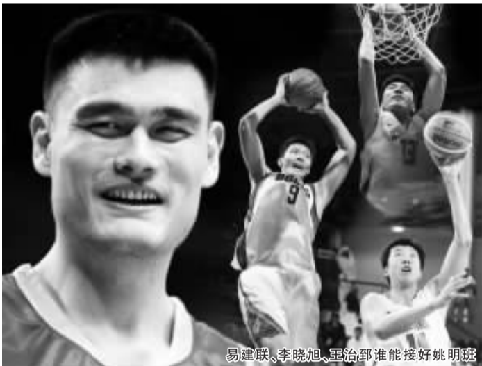
易建联、李晓旭、王治郅谁能接好姚明班

队的苏伟因防住巴特尔而一战成名,这名体重120公斤的大块头防守功夫不错,不过他攻击能力差的缺点也很明显。