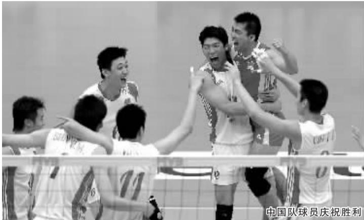
中国队球员庆祝胜利

在绝大多数时间里都保持比分领先。人高马大的荷兰队显得束手束脚,没能充分发挥他们在网上的优势,无论是进攻还是拦网都要稍逊一筹,而且主动失误很多,首局最后